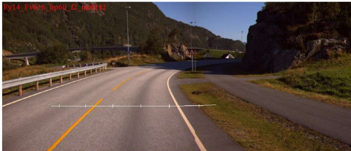
Figur 1: Retning fra Svelgen