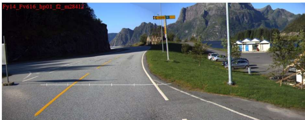
Figur 2: Retning fra Oldeide