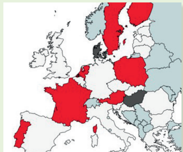
Trender i desentralisering av forskings- og utviklingspolitikken (raud = auka desentralisering; mørkegrå = auka sentralisering; kvit = inga endring).

fonda i Noreg. Den er ei ajourføring av ein tilsvarande studie gjennomført på oppdrag frå Forskningsrådet og fonda i 2012.