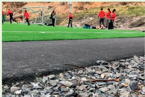
Stemmemyren i Bergen er det første kunstgrasanlegget der ein har kartlagt mikroplast i nærområdet.

Prosjektet fekk tre millionar kroner i støtte frå RFF Vestlandet i 2018.