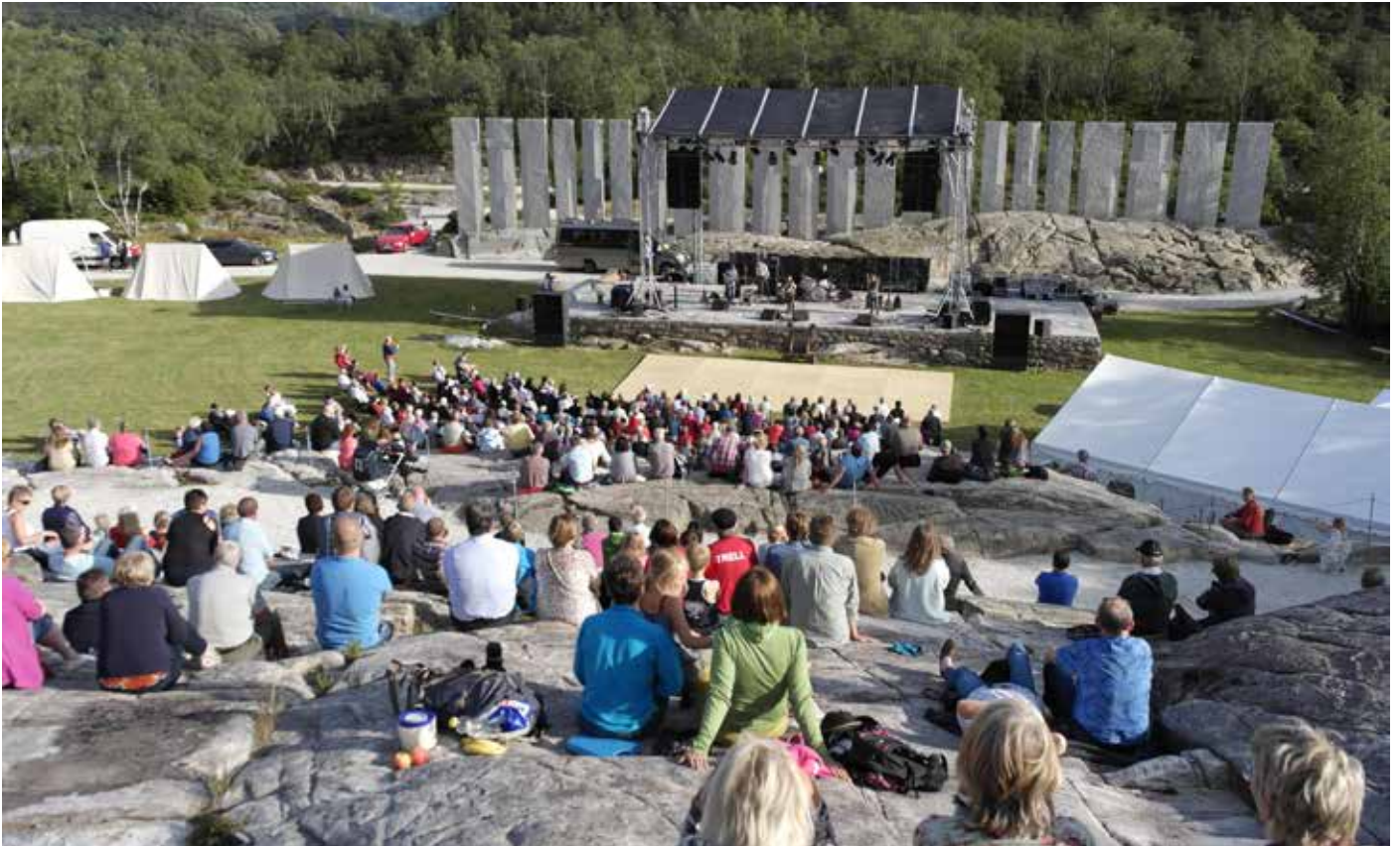
Naturleg amfi på Tusenårsstaden Gulatinget.

Hovudmålet er å lyfte fram og formidle historia om Gulatinget, og med det syne dei verdiane Gulatinget representerte.