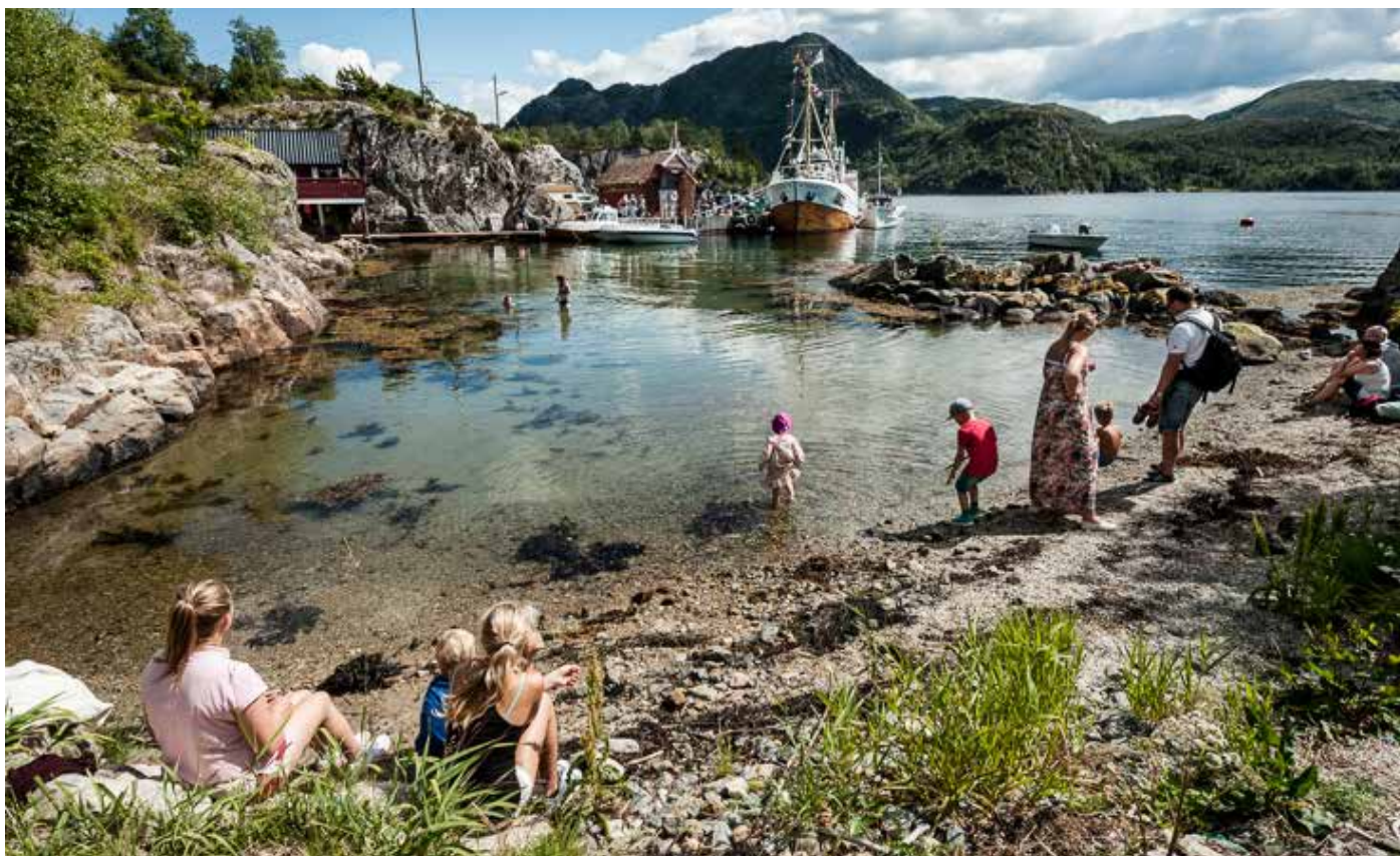
Badeplass og gjestehamn på Tusenårsstaden Gulatinget.

Mange reisande ønskjer opplevingar knytt til reisemål. Arbeidet Tusenårsstaden Gulatinget legg ned i fagleg utvikling skal bidra til lokal og regional verdiskaping ved at fleire besøkjer staden og nyttar seg av lokale servicetilbod. Samarbeid mellom kommunen og dei lokal aktørane er prioritert.