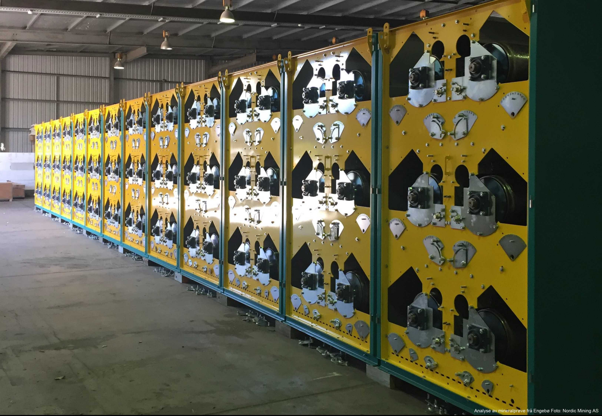
Analyse av mineralprøve fra Engebø