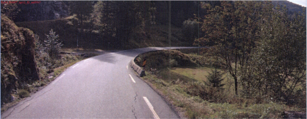
[11.09.2013-14:18 P14] Sogn og Fjordane Fv057 hp12 fl m0751 [kan være unødvendig]