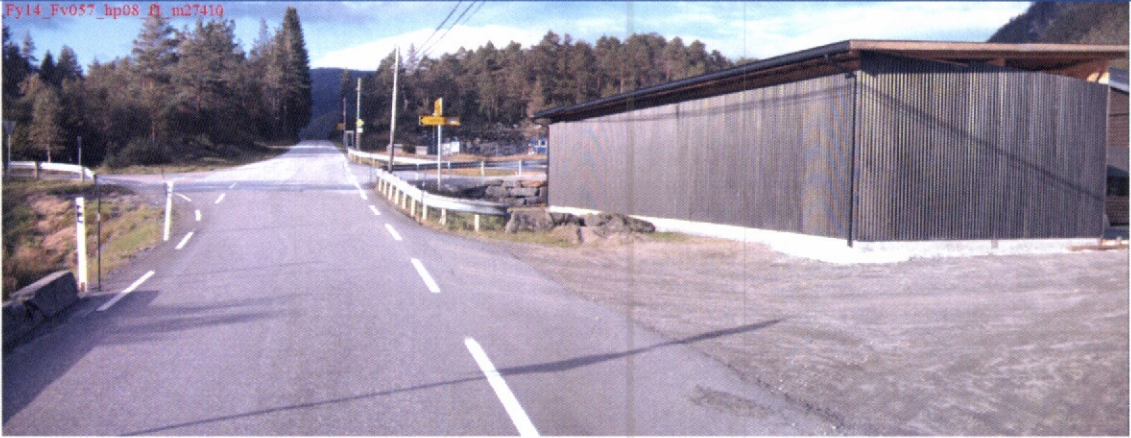
[11.09.2013-18:04 P14] Sogn og Fjordane Fv057 hp08 fl m27410 [kan være unødvendig]