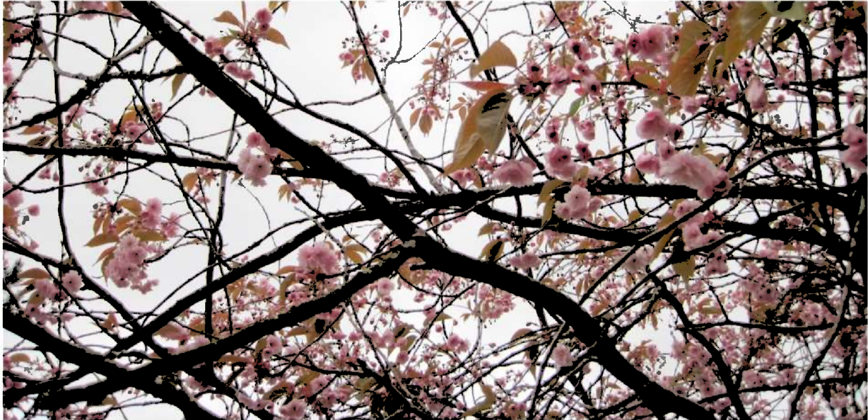
Foto: Japansk prydkisebærtre, Stryn sentrum 2015.

Utvikling av attraktive tettstadar med gode og varierte tilbod er viktig for å halde oppe busettinga. Kampen om kompetanse og arbeidskraft i framtida gir auka merksemd på attraktivitet. God sentrumsutvikling er difor også god næringsutvikling.