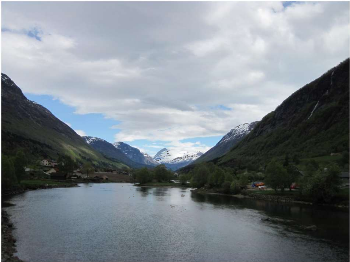
Foto: Stryn/Stryneelva 7. mai 2014. Utsyn mot aust. Av Mona Elisabeth Steinsland, Sogn og Fjordane fylkeskommunen.