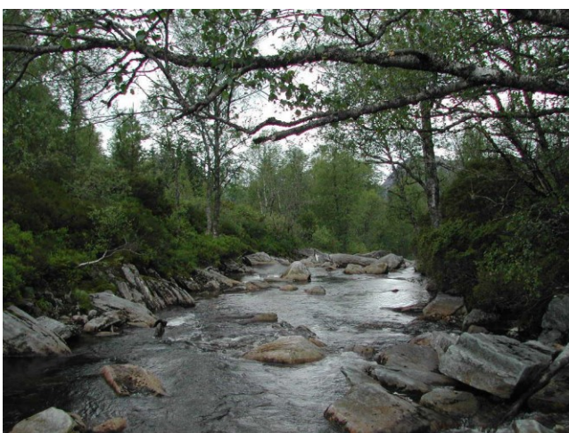
Eksempel på inntak, større anlegg enn Eldeelva.