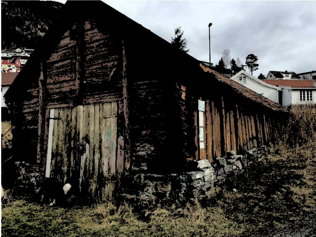
Naustet vart delvis restaurert i regi av Sogelaget (sjå bilete).