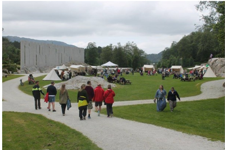
Vikinghelg på Gulatinget

25. november Julemarknad på Gulatinget, Frendar vikinglag.