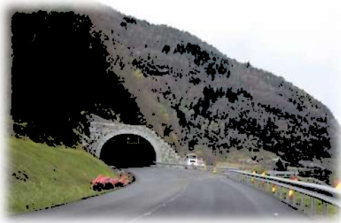
Ferdig tunnel aust