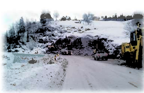
Oppstart tunneldriving januar 2011