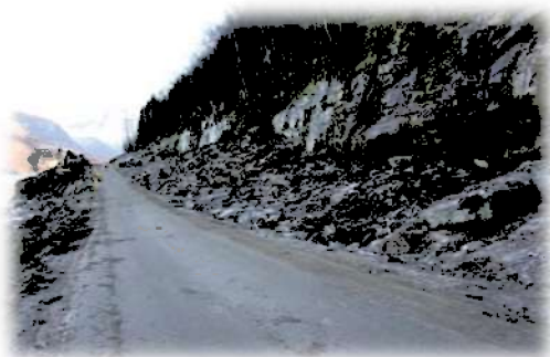
Avdekking av lausmassar aust for Holetunnelen, desember 2010