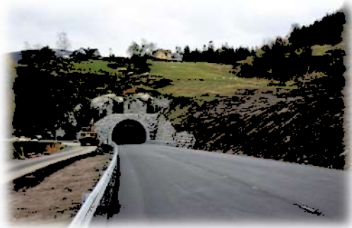
Ferdig tunnel vest