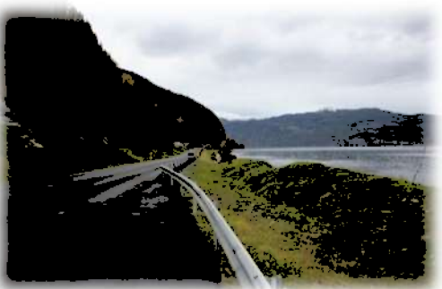
Ny tofeltsveg aust for Holetunnelen