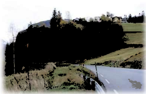
Holetunnelen før anleggsstart