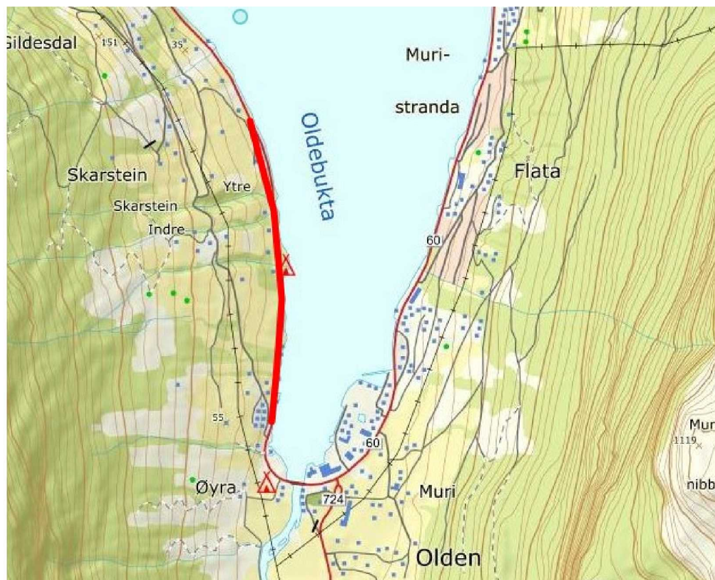
Oversiktskart: Område for regulert gang- og sykkelveg