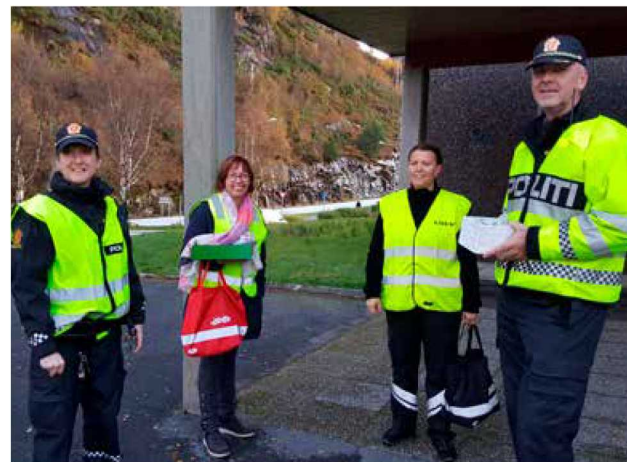
Frå refleksdagen 2018 i Måløy.