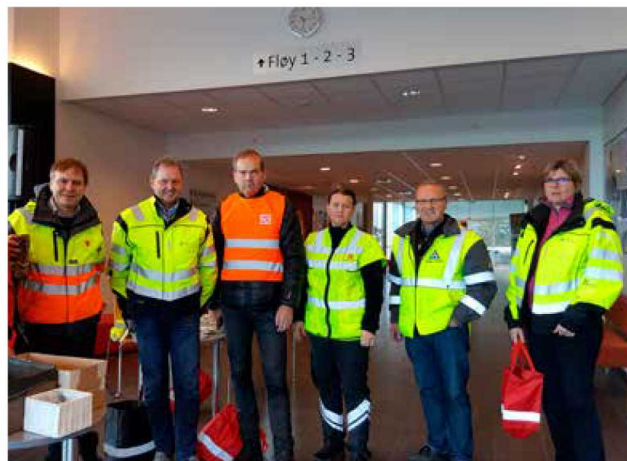
Samarbeidspartnarane på refleksdagen 2018.

Trygg Trafikk har eit godt og langt samarbeid med Sogn og Fjordane Fotballkrets og fylkestrafikktryggingssutvalet (FTU). Det er laga kriterium for å bli ein trafikksikker fotballklubb, og dette året blei Kaupanger idrettslag godkjent som trafikksikker fotballklubb. Frå før var Sandane, Vik, Jotun, Stryn og Førde fotballklubb godkjende. Dette er eit viktig arbeid for å få klubbane til å setje trafikktryggingssarbeidet i system. Fleire klubbar jobbar for å bli godkjende til neste år.