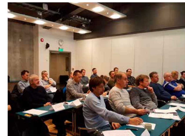
Frå nettverksmøte i Sogndal med ungdomsskulelærarane som driv med valfaget trafikk og trafikalt grunnkurs.

retningslinjene. Det er no foreldra og ikkje skulen som skal bestemme når borna kan få lov til å sykle til og frå skulen. Trygg Trafikk tilrår som tidlegare at barna bør vere ti-tolv år før dei sykklar åleine i blanda trafikk.