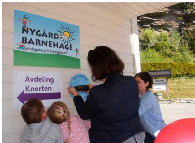
Frå opninga av Nygård barnehage som Trafikksikker barnehage.