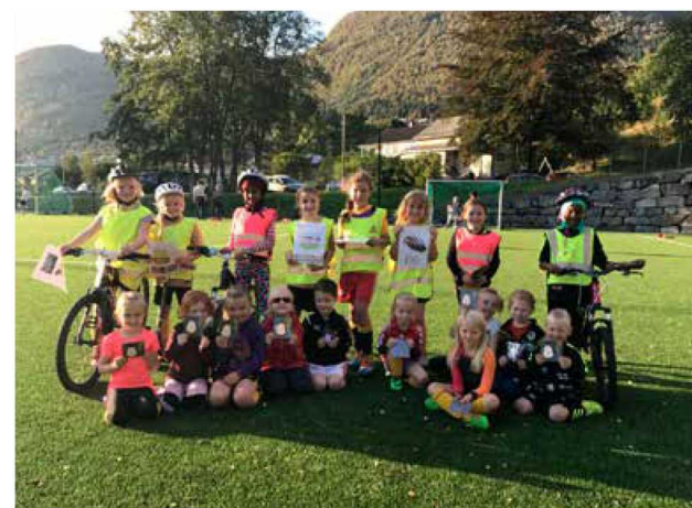
Vinnarane av reflekskonkurransen: id idrettslag, jenter 5–6 og 8 år.