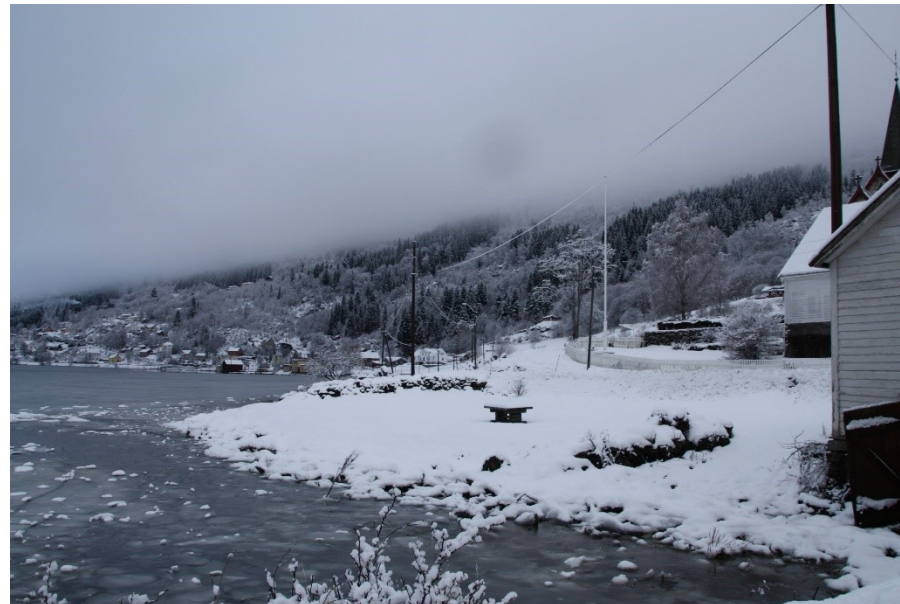
Bileta syner strandsona. Biletet til venstre er tatt frå nabogrensa mot nauset, medan biletet til høgre er tatt frå båthamna.