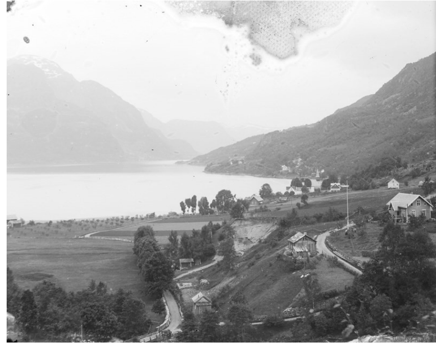
Bileta syner Dale kyrkje med prestegarden ved sida av mot fjorden.