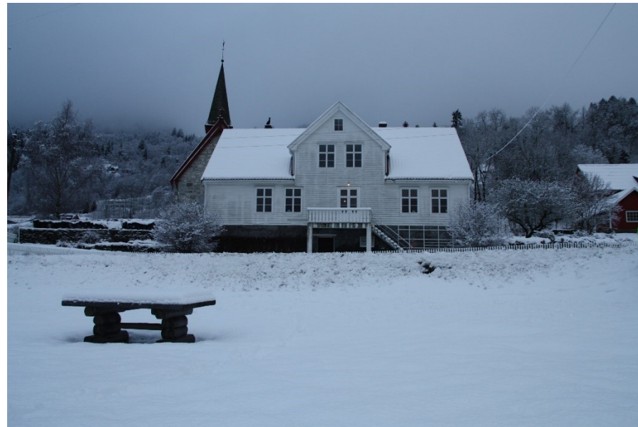
Biletet til venstre syner prestegardsnauset sett frå tomtegrensa til prestegarden. Biletet til høgre er tatt frå stranda mot prestegarden. Parkeringsplassen kjen om lag fram ti der bordet står.