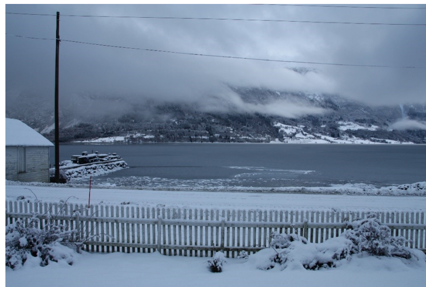
Planområdet sett frå prestegardshagen.