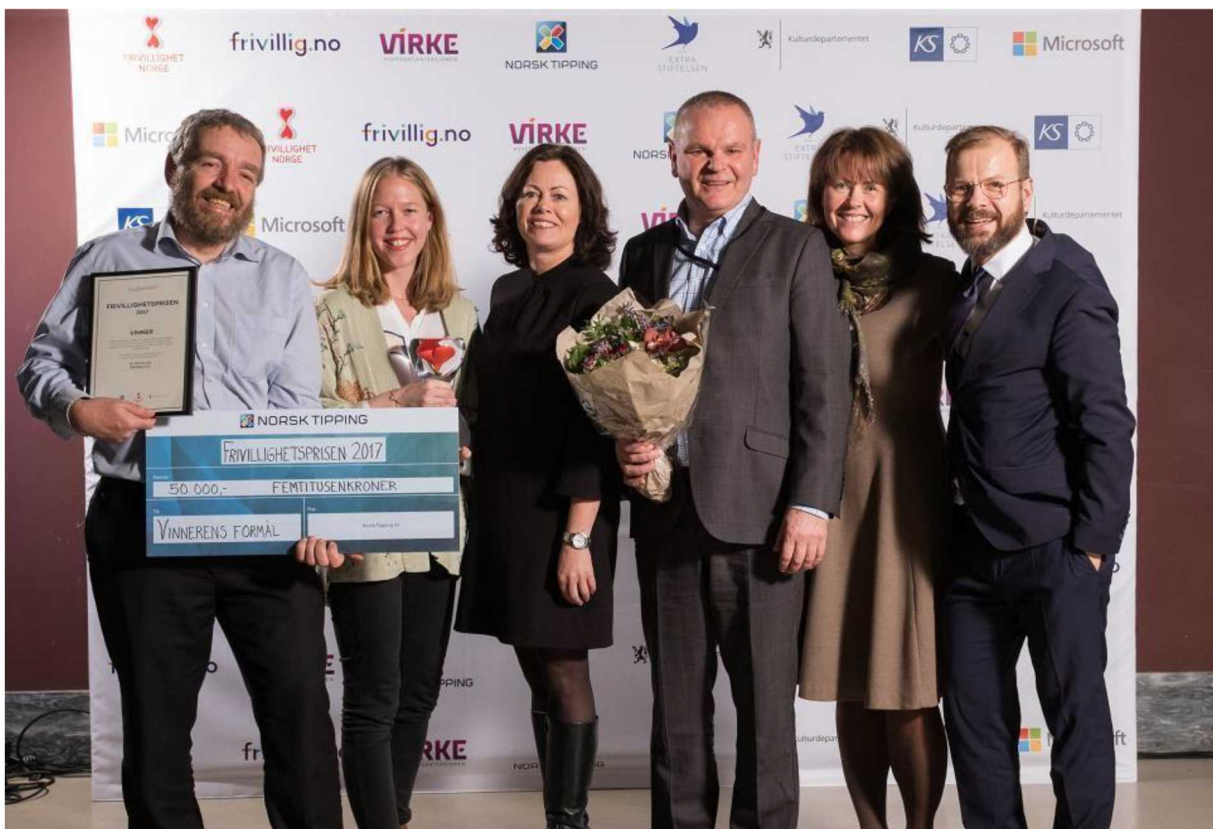
Kirkens SOS mottok Frivillighetsprisen 2017