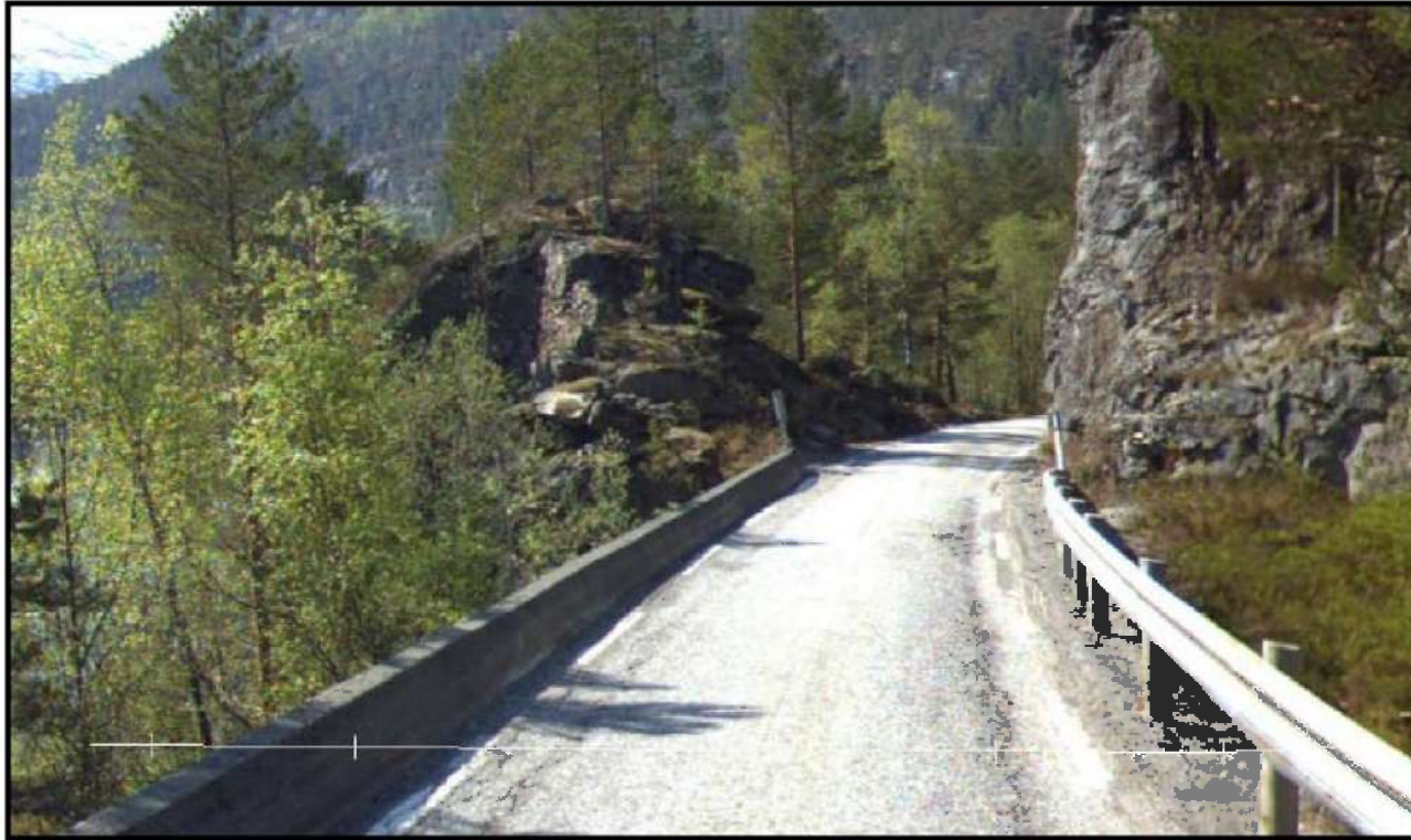
Figur 5.5: Vegen over Høgemuren er smal og har dårleg sikt

Høgemuren har det meste av det verste: Bratt, smal og dårleg sikt.