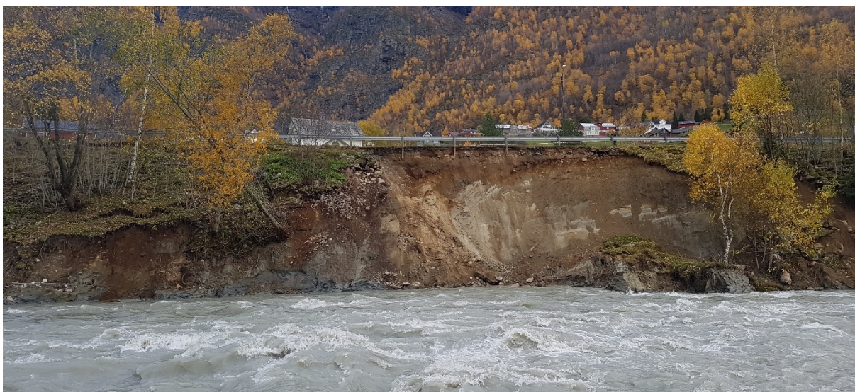
Bilde teke 15/10 ca kl. 12 ved Smiebakken. Her rasa det kontinuerleg utover dagen. Området sperra av politiet. Foto: Svein Jarle Slinde, Statens Vegvesen

Foto: Svein Jarle Slinde, Statens Vegvesen