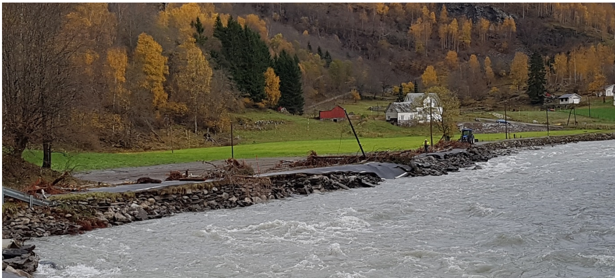
Moen i Mørkridsdalen