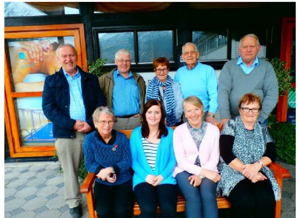
Fylkesrådet for eldre i Møre og Romsdal

I etterkant av fellesmøtet hadde fylkesrådet for eldre møte, der ei sakene som vart diskutert var «Personsamanfall medlemmer i fylkesrådet for eldre og fylkesrådet for funksjonshemma – til uttale i fylkesråda.» For uttalen frå fylkesrådet for eldre; sjå vedlegg.