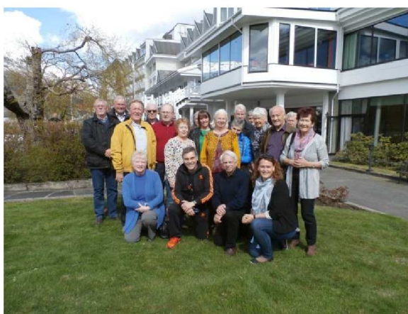
Fylkesråda for eldre i Sogn og Fjordane, Hordaland og Rogaland samla i Ullensvang 28. – 29. april 2015.