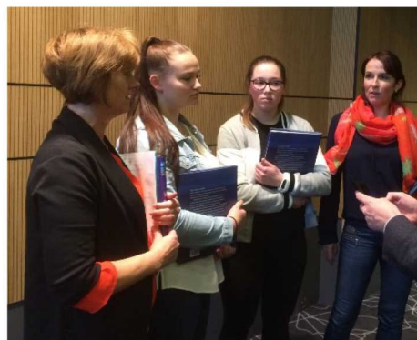
Lærarar og elevar frå Stryn vidaregåande skule.