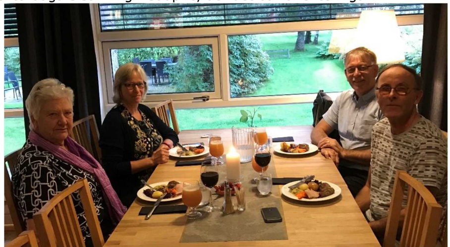
Fylkesrådet samla til middag i samband med to-dagars samlinga i Gaupne.