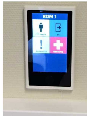
Ulike hjelpemiddel i opplæringsleilegheita.

omvisinga og informasjonen var det erfaringsutveksling mellom fylkesrådet og det kommunale rådet i Stryn.