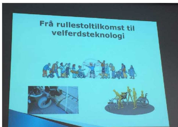
Regjeringa sin visjon er at Norge skal vere universelt utforma innan 2025

Dei som hadde delteke på SOR-konferansen i Bergen orienterte om nyttig informasjon dei hadde fått på konferansen. Fylkesrådet vedtok å sende svar til samferdsleavdelinga om at dei var opne for og hadde ynskje om å verte involvert i prosessen med planprogrammet for regional transportplan.