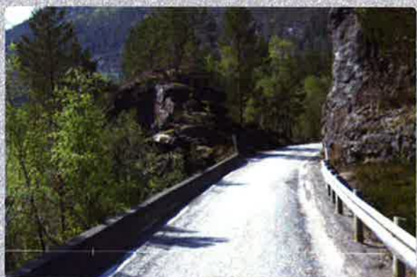
Høgemuren har det meste av det verste: Bratt, smal, sving og dårleg sikt.