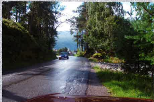
Sandane - Bukta Gang og sykkelveg