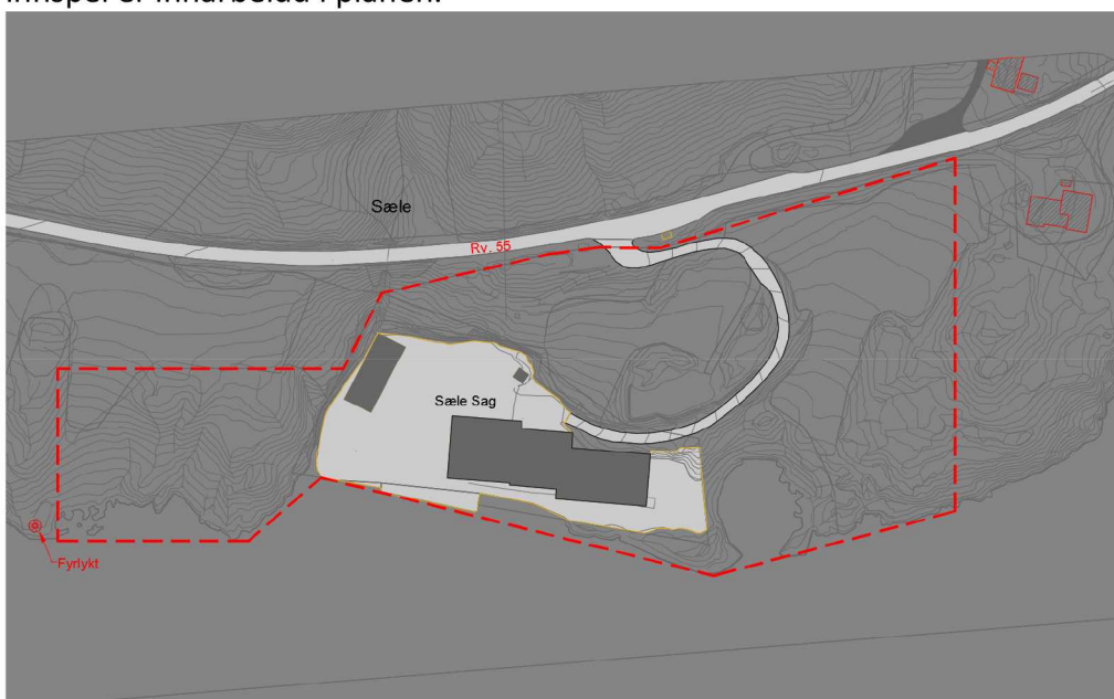
Illustrasjon over området. Planområdet ligg innafor stipla linje.

Det kom inn i alt 8 innspel i samband med varslinga, frå naboar og offentlege instansar. I kapittel 6 er innspela summerte opp og kommenterte, og det er gjort greie for korleis innspel er innarbeidd i planen.