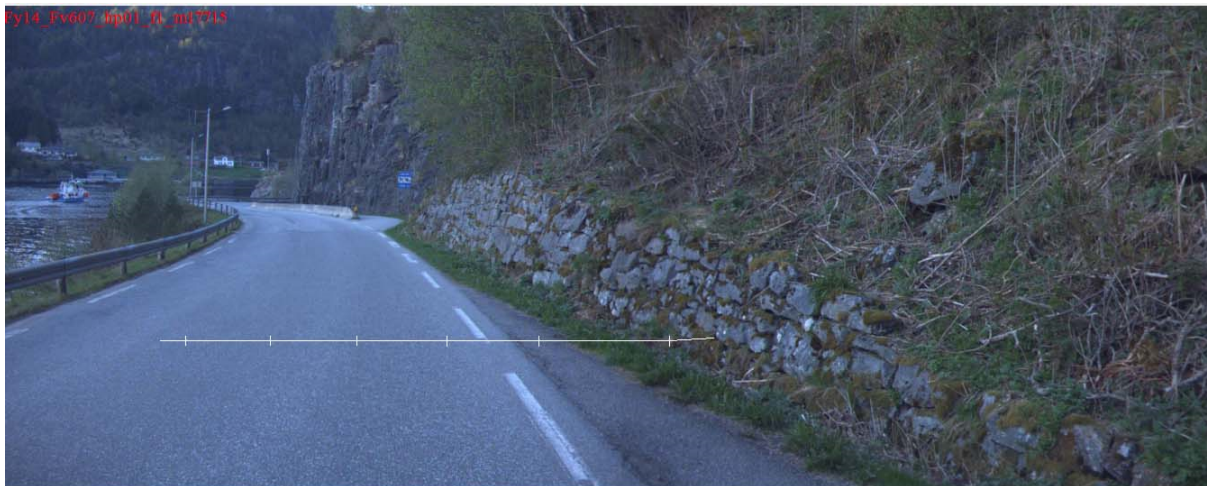
Bilde 1: Ur i område frå km 17,690 til 17,750