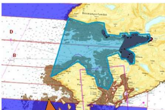
Figur 1 Bremanger sitt framlegg til nye grenser for trålefritt område i Bremangerpollen

Figur 2 viser Fiskeridirektoratet region Vest sitt forslag til nye stengte område i Bremanger, der dei vil opne for tråling i eit område frå Rylandspollen til Løvikskjeret, i forhold til dagens forskrift.