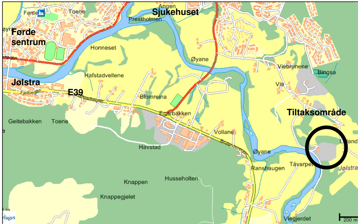
Figur 2. Lokalisering av planområdet

Tiltaksområdet ligg på Vie om lag 3 km aust for Førde sentrum, jf figur 2. Området ligg like aust for elva Jølstra og er omgitt av landbruksareal og gardstun. Eksisterande masseuttak inngår i planområdet.