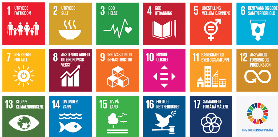
Figur 2 FN sine 17 globale mål for ei berekraftig utvikling

Ei berekraftig utvikling handlar om å tilfredsstille behov vi har i dag, utan å øydeleggje for komande generasjonar sine mogelegheiter til å tilfredsstille sine framtidige behov. FN's medlemsland har vedteke 17 globale felles mål for ei berekraftig utvikling og desse blir førande for norsk utviklingspolitikk fram mot 2030. Dei nye berekraftsmåla ser miljø, økonomi og sosial utvikling i samanheng, og er ein felles plan for korleis vi kan utrydde fattigdom, utjamne sosiale ulikskapar og stoppe klimaendringane innan 2030.