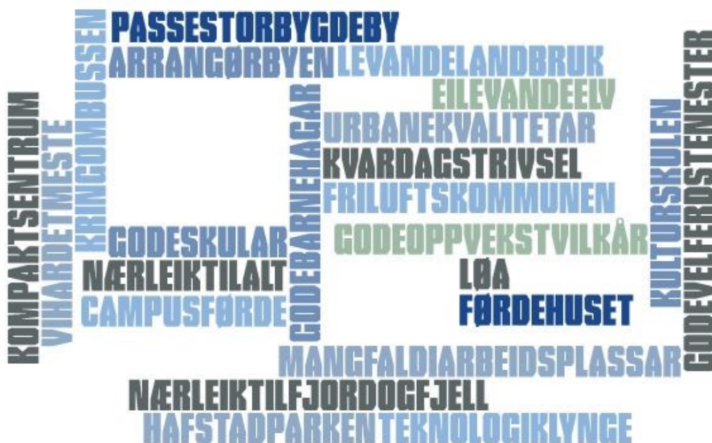
Figur 1 Nokre av bystyret sine innspel til Førdesamfunnet sin omdømmepakke

Mange av innspela frå medverknadsprosessane vil først kome fram i kommuneplanen sin handlingsdel og andre prosessar i organisasjonen. I samfunnsplanen fokuserer vi på overordna målsettingar og vegval for dei neste 12 åra. Desse skal, som nemnt, tydeleggjerast gjennom kommuneplanen sin arealdel, og vidare gjennom ein handlingsdel med tilhøyrande økonomiplan. Handlingsdelen vert konkretisert gjennom kommunen sitt årsbudsjett og handlingsplanar/tiltaksplanar. Intensjonen er at mål og tiltak for kvart år er ein del av ein «raud tråd» som heng saman med overordna mål frå samfunnsdelen.