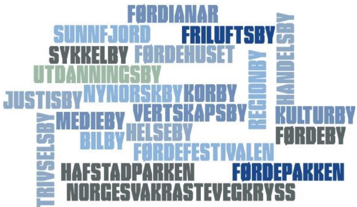
Figur 4 Vi har mykje å vere stolte av i Førde!

Kommuneplanen skal ha ei sterk kopling mellom samfunnsdel og arealdel. Samfunnsdelen gjev føringar for arealdelen mellom anna ved at den seier noko om folketalsutvikling og utbyggingsmønster. Dei konkrete føringane for arealdelen er synleggjort i handlingsdelen i planen. Sist i planen har vi eit kapittel om føringar for kommuneplanen sin handlingsdel. Kommuneplanen har eit 12-års perspektiv, medan handlingsdelen ser nærare på kva som skal prioriterast dei næraste 4 åra. Ut i frå dei tiltaka som er skissert i planen, har vi derfor valt å trekkje ut 10 tiltak som særskilt skal prioriterast dei komande 4 åra, og som vert lagt inn i handlingsdelen.