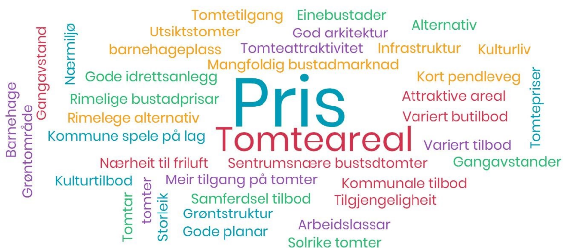
Figur 7 Politikerane sitt mentometer om kva som skal til for å auke bustadattraktiviteten