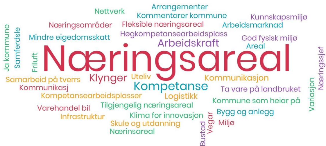
Figur 5 Førde bystyre sitt mentometer om kva som skal til for å auke næringsattraktiviteten