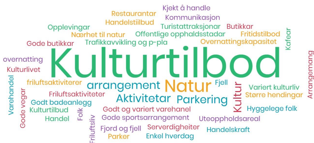
Figur 6 Politikerane sitt mentometer for kva som kan bidra til å auke attraktiviteten til Førde