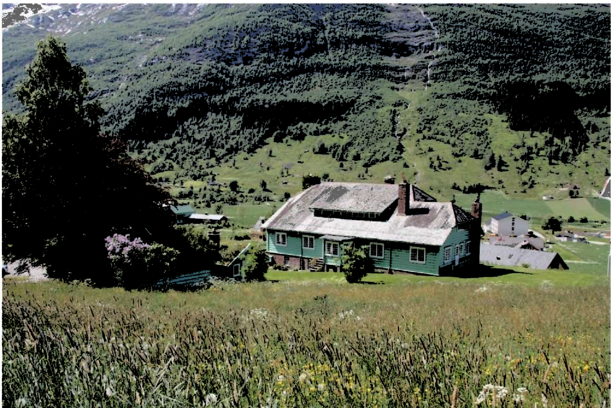
Figur 2. Tunet sett frå nord. Der vi ser baksida av hovudhuset, lengst til venstre er stabburet og framfor det ligg tenarbustaden/drengestova. Kafeen er skjult bak treet til venstre.