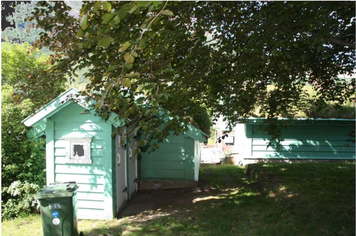
Figur 11. Tilbygget med utedo og lager. Utedoen er bak det kvadratiske vindaugget. På det flate arealet til høgre stod opphavleg ishuset.

I forlenging av kafeen er det bygd eit tilbygg som inneheld ein utedo og eit lagerrom. Tilbygget er i reisverk og kledd med liggande panel. Saltaket er tekka med torv slik som på kafeen. På langsida er det to dører, ei inn til toalettet og ei inn til lageret. Døra til toalettet har ein kvadratisk lufteventil øvst. I gavlen er det eit lite kvadratisk vindauga som gjev lys inn til toalettet.