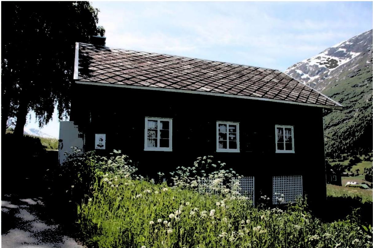
Figur 14. Vedhuset sett frå vegen.

Vedhuset er plassert ved bungalowen eit godt stykke vekk i frå tunet til hovudhuset. Opphavleg var det også bygd drivhus her. Eitt som ei forlenging av langveggen til vedhuset og to som stod frittstående vinkelrett på vedhuset. Utanfor drivhusa og vedhuset var det opphavleg grønsaksåkrar som var ein del hushaldet på Dalheim.