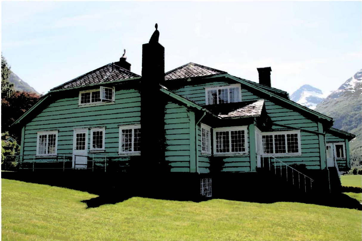
Figur 7. Vestsida av villaen. trappa til høgre leiar opp til hovudinngangen.

Utforminga av villaen skil seg vesentleg frå den samtidige villaarkitekturen i Noreg. Med sitt låge langstrakte preg, og mange samansatte volum flyt den ut over og glir inn i det storslåtte landskapet i Olden. Bilvegen går opp til kjøkkeninngangen og tidlegare var det ein gangsti frå Studio og opp til hovudinngangen. Ein gangsti gjekk og frå tunet ved kjøkken inngangen rundt på framsida av huset og til hage- og hovudinngangane. Karakteristisk for villaen er det låge langstrakte preget, dei mange småruta vindauga og dei store taka med svært open takvinkel og flate takopplett på begge langsiden. Den skarpe mintgrønefargen på villaen og dei andre bygningane er eit framandelement i vestlandsarkitekturen og bidreg til at huset skil seg frå dei tradisjonelle bygningane i området.