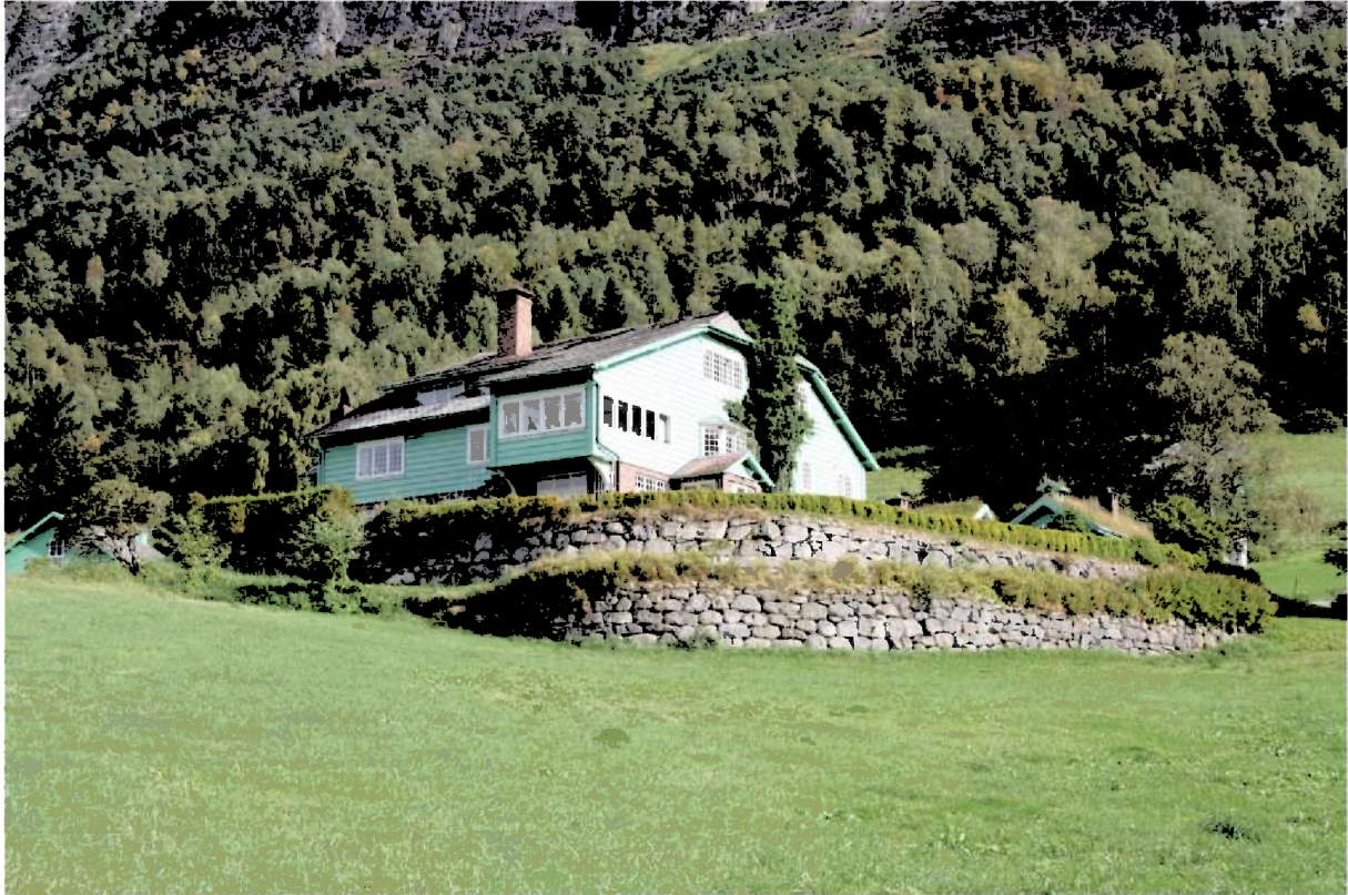
Figur 3. Hovudhuset og hagen sett frå Studio. Lengst til venstre er taket på vedhuset og til høgre vises litt av taket til tenarbudstaden og kafeen. Foto frå 2015.