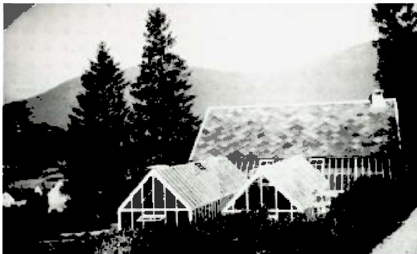
Figur 18. Foto henta frå William H.

Singer. Kunstnaren og samfunnsmennesket - Lokalhistorisk skrift frå Olden-