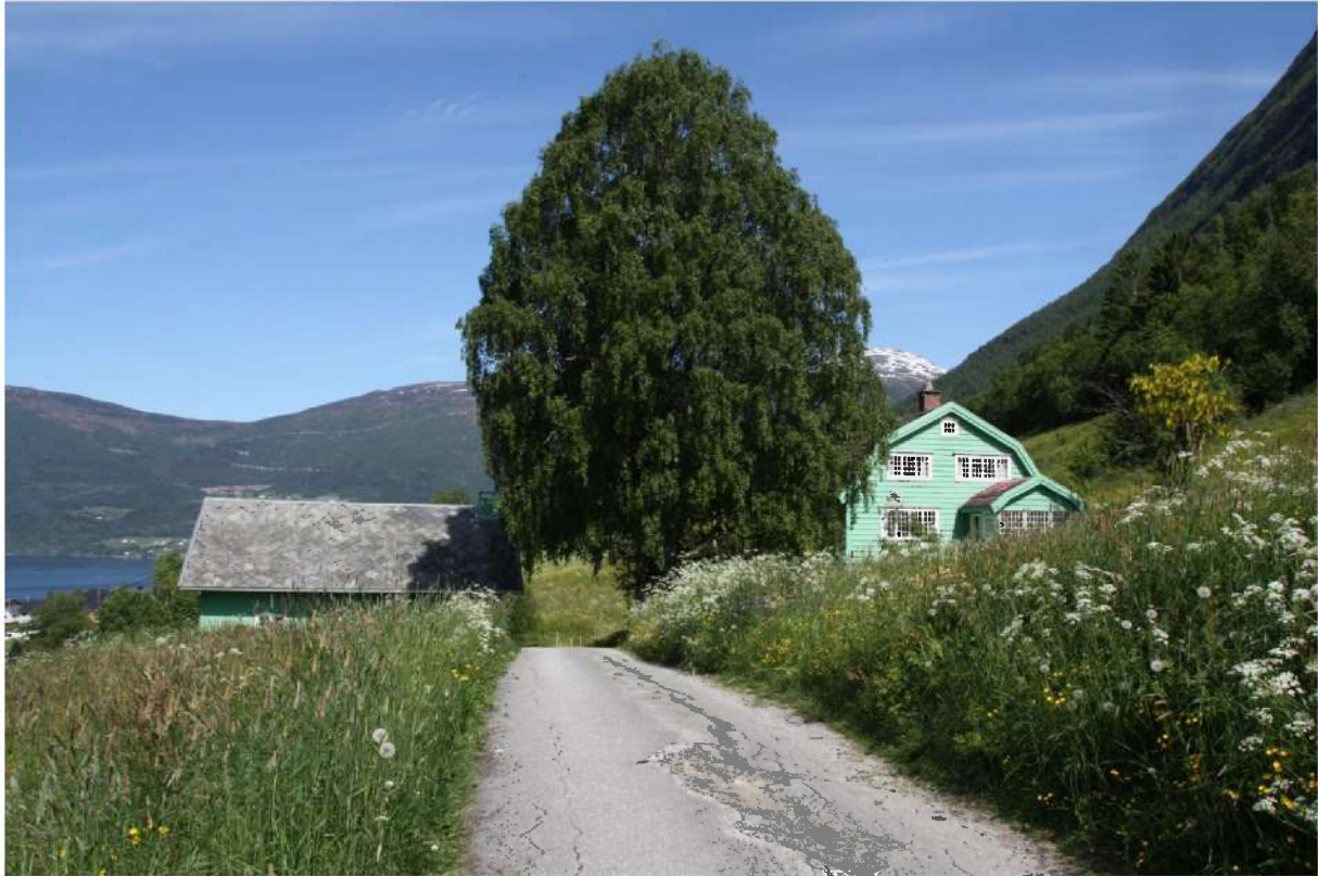
Figur 5. Bungalowen og vedhuset sett frå vegen frå driftsbygningen.