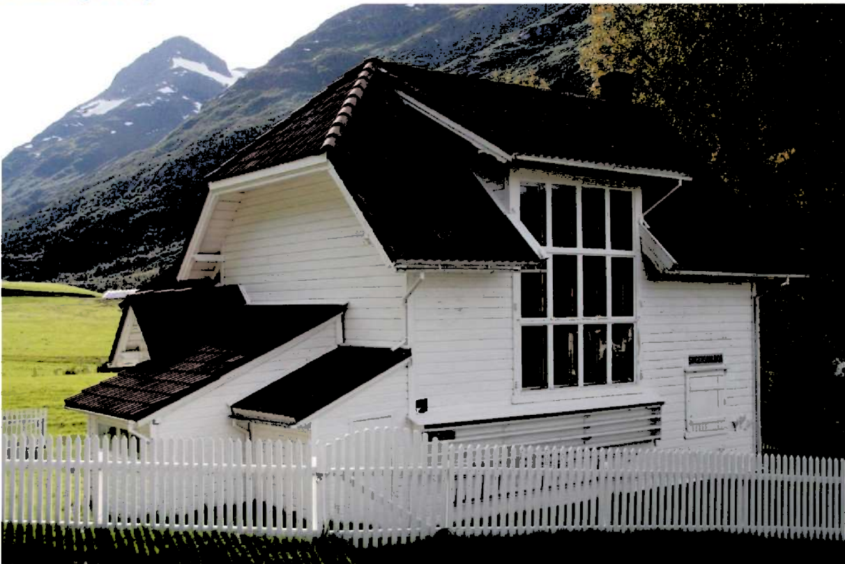
Figur 16. Studio med det karakteristiske ateliervindauga og hyllene til fiskestenger og agn. Foto frå 2015.