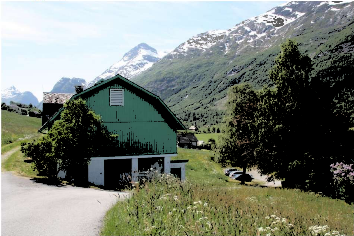
Figur 13. Vestgavlen til låven

Fru Singer var svært opptatt av gardsdrifta på Dalheim og garden vart driven som eit mønsterbruk. I fylje Singer var mjølka på Dalheim dyrare enn champagne som ei fylje av måten dyra vart tatt vare på. Fjøsen med låve er ikkje ein tradisjonell norsk driftsbygning i utsjånad og vi ser her tydelege felles trekk med dei amerikanske låvebygningane, spesielt i val av takkonstruksjon.