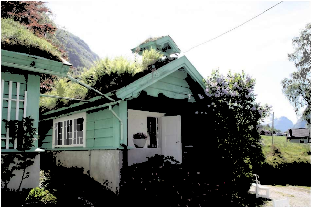
Figur 10. Kafeen med det overbygde inngangspartiet og trappa opp frå tunet. Til venstre er hjørnet på tenarbustaden.

Kafeen vart nytta som matrom for tenarane. Om sommaren var det mange menneske som arbeidde på Dalheim og det vart ikkje plass til at alle kunne ete på kjøkkenet. Kafeen var bygd like bak hovudhuset, ved sida av tenarbustaden, slik at det var kort veg frå kjøkkenet i hovudhuset til kafeen. I bakre del av bygningen er det eit rom som har hatt funksjon som eldhus.