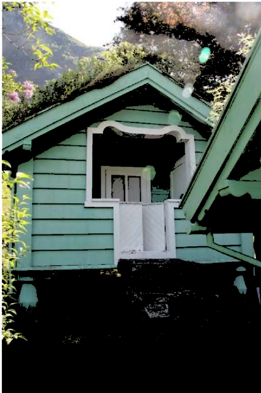
Figur 12. Det overbygde inngangspartiet ti lstaburet.

Stabburet er plassert med møneretninga vinkelrett mot baksida på tenarbustaden og vart nytta til oppbevaring av matvarer.