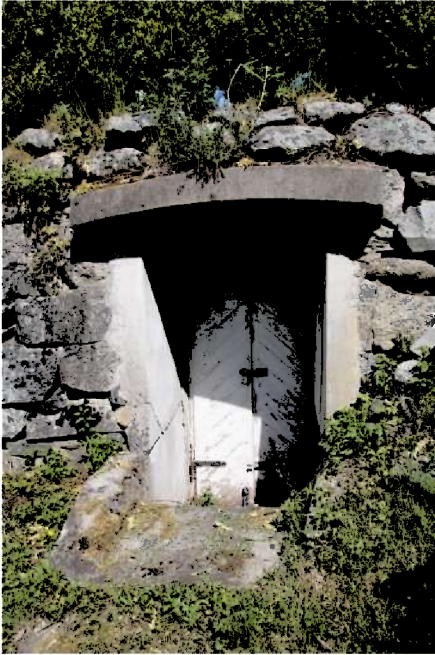
Figur 15. Inngangsdøra til jordkjellaren bak hagemuren.

I muren ved hovudhuset er det bygd inn ein jordkjellar til oppbevaring av mat. Inngangen er via ei dobbel labankdør kled med skråstilt panel. Sidene av døra og overbygget er i betong. Resten av jordkjellaren er skjult bak bakkemuren til hagen.