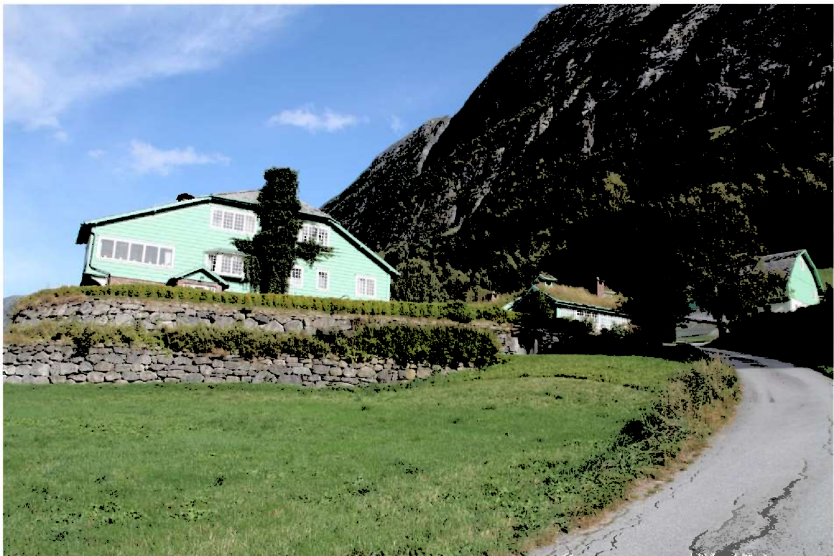
Figur 4. Tunet sett frå vegen ved Studio. Villaen til venstre. Lengst til høgre er låven. Mellom driftsbygningen og villaen ser vi kafeen og litt av taket på tenarbustaden. Inngangen til jordkjellaren er lengst til høgre i muren. Foto frå 2015.