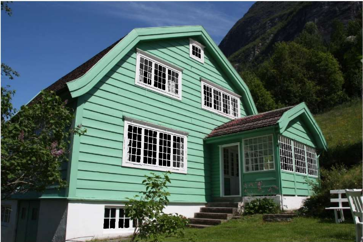
Figur 8. Bungalowen med glasverandaen som danner inngangspartiet.