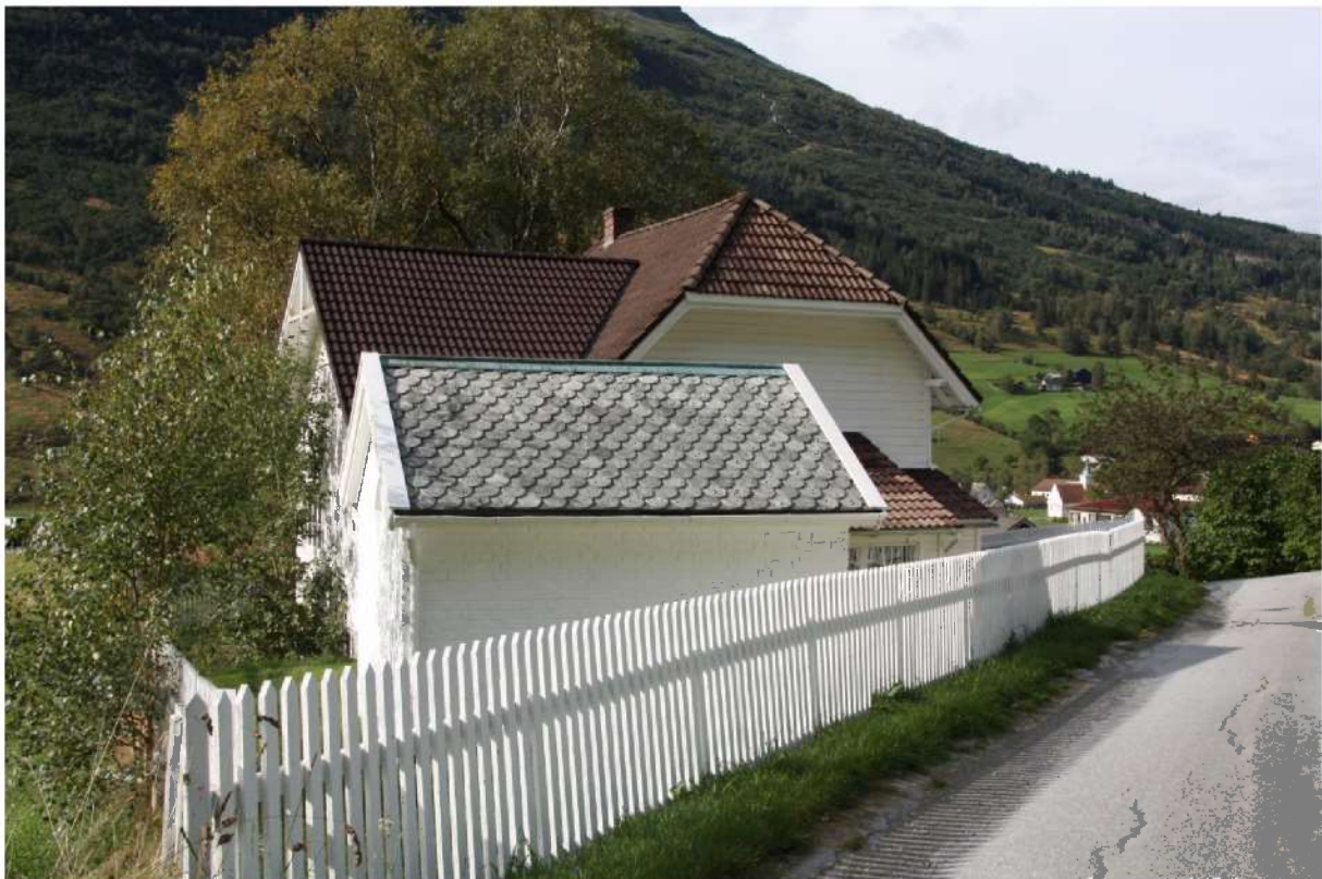
Figur 6. Gravkapellet og Studio. Foto frå 2015

I tillegg til bygningane var hageanlegget ein viktig del av eigedommen. Delar av arealet vart brukt til slåttemark, men omkring villaen og bungalowen vart det bygd opp ein vakker hage. Ved villaen er hagen terrassert opp ved hjelp av store bakkemurar og beplanta. Mykje av hageanlegget er framleis