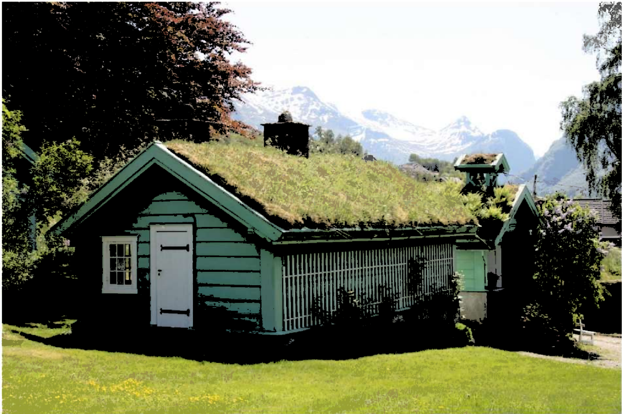
Figur 9. Tenarbustaden som ligg parallelt med hovudhuset.