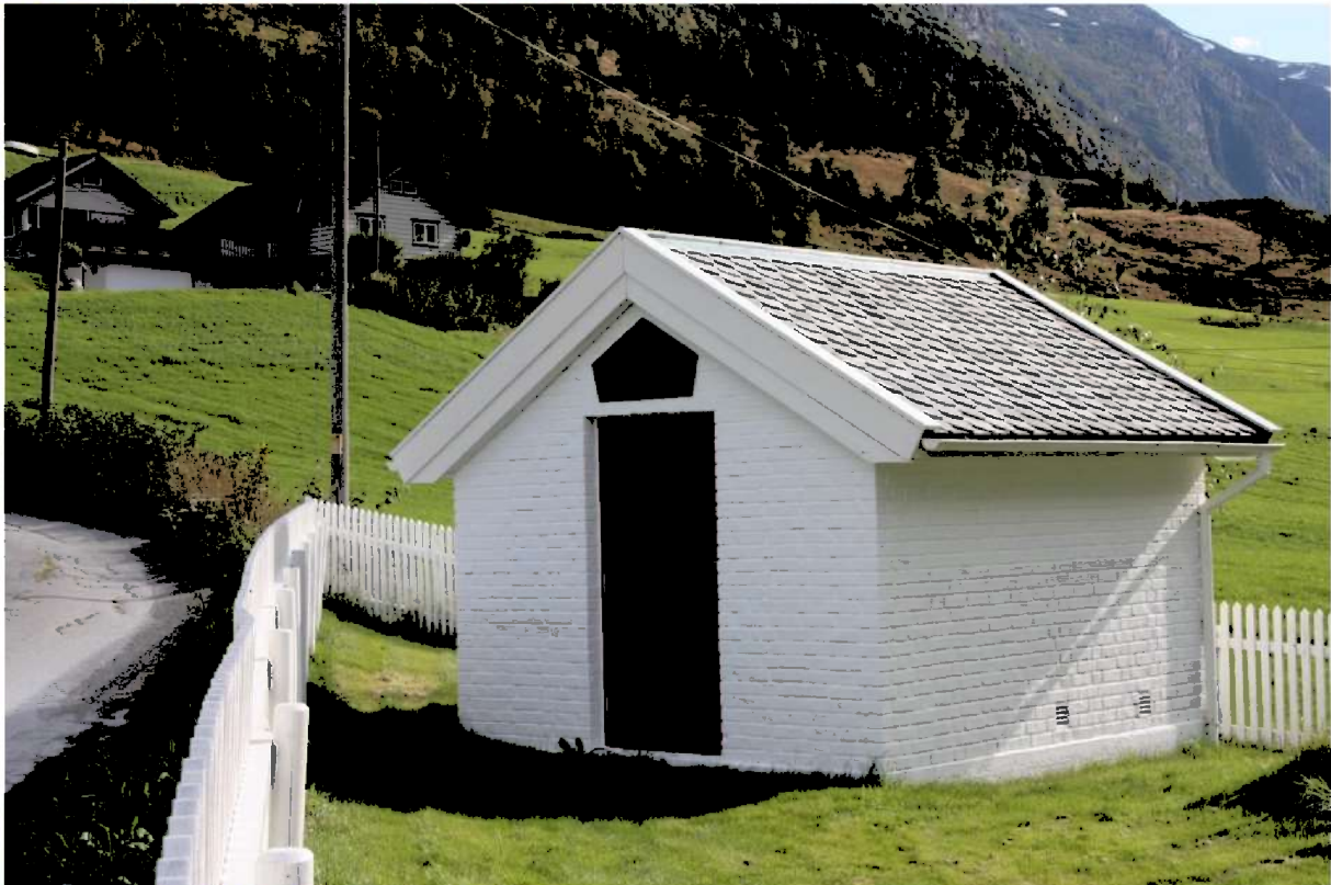
Figur 17. Gravkapellet sett frå Studio. Foto frå 2015.