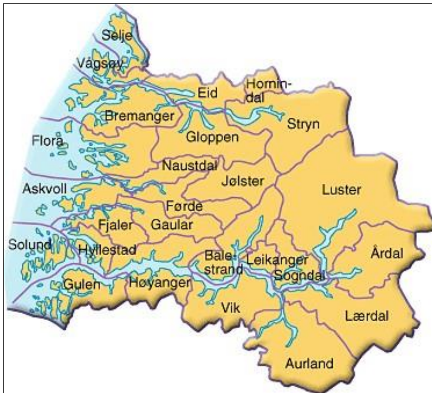
Figur 2.1 Kommunene i Sogn og Fjordane