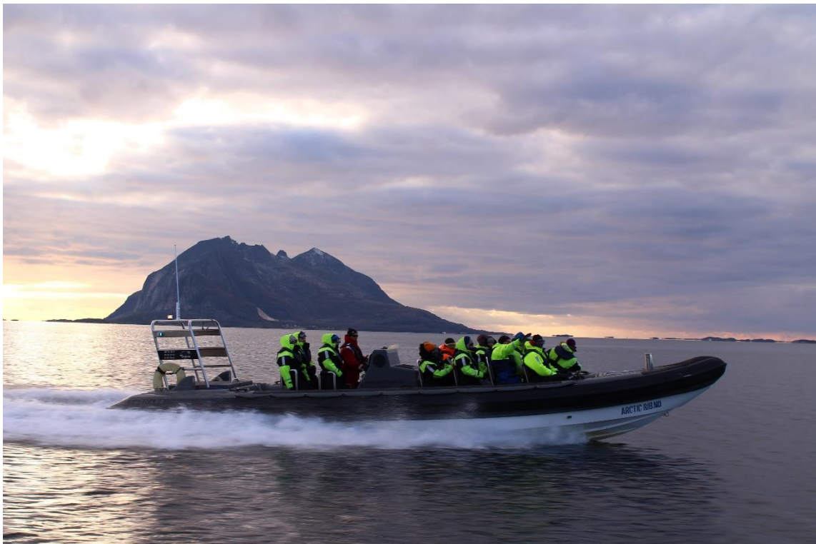
Akvakulturfagmiljøet i fylkeskommunene på fagsamling i Bodø høsten 2014.

For mer utfyllende beskrivelse av resultatmålene vises det til rapporten fra forprosjektet, side 5 og 6.