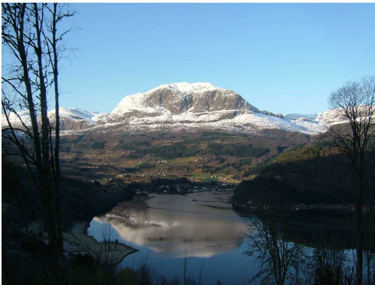
Utsyn frå Skyggeelv mot Dalsfjorden og Bygstad. Mot SV.