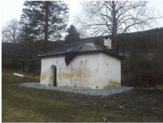
Før restaureringen startet 2015.