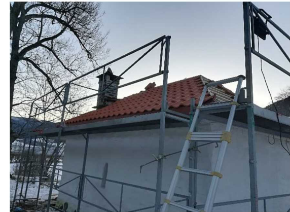
Nesten ferdig, med takstein.