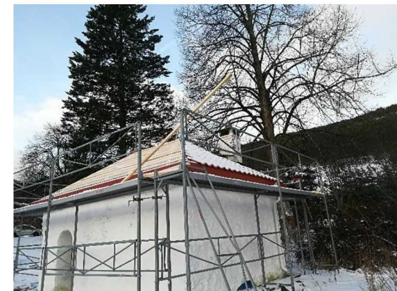
Mangler takrenne ellers ferdigrestaurert.