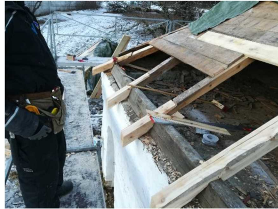
Under restaurering av taket.