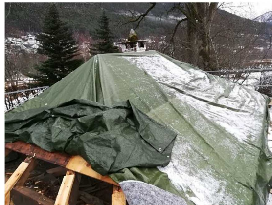
Under restaurering av taket.