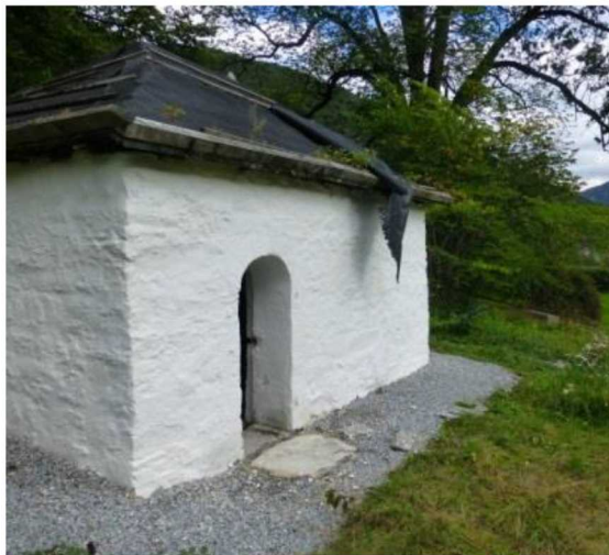
Etter restaureringen i 2015.