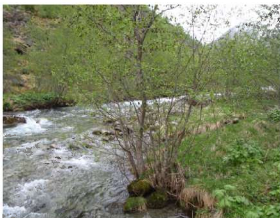
Dam og inntak er planlagt i dette området.

Inntaksdammen på kote 202 skal byggast i betong med høgde 3 meter og lengde 45 meter. Oppstrøms dammen skal det gravast ut masse for å få til ein kulp som kan sikre gode inntaksforhold. Oppdemt areal vil bli 2,3 da og volum 5000 m 3 . Det må byggast om lag 60 meter veg frå eksisterande veg til inntaket. Vassvegen nedover er planlagt som nedgravde rør, 1,7 km, langs eksisterande veg på nordvestsida til elva. Ved ca. kote 120 er det planlagt at rørgrøfta skal krysse under elva til sørsida. Her skal det også byggast ei ny bru over elva og vidare veg og rørgate nedover til planlagt kraftstasjon ved Grøte. Kraftstasjonsbygningen vil få ei grunnflate på 130 m 2 . Det er planlagt omløpsventil i stasjonen for å sikre vassføring i elva ved stans i kraftverket. Det skal leggjast 50 meter jordkabel fram til ei eksisterande 22 kV linje.