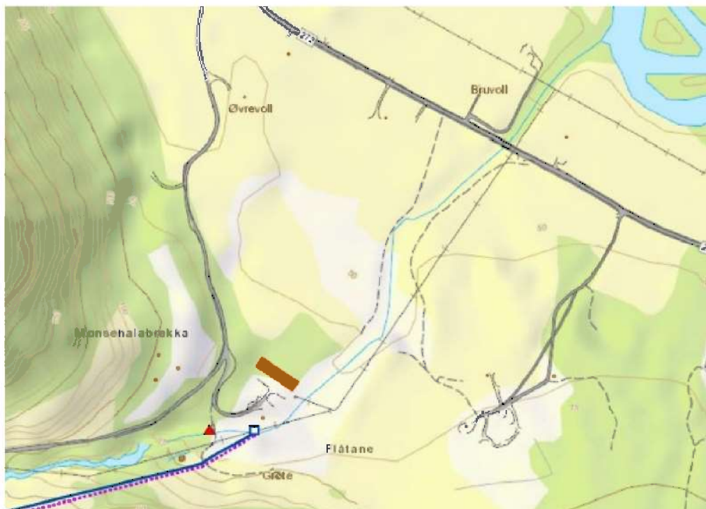
Kraftstasjon og vandringshinder i Kuvelda. Vandringshinderet er markert med rød trekant.

Kraftverket er planlagt like ved vandringshinderet for anadrom fisk. Utløpet fra kraftverket er planlagt ca. 60 m nedstrøms vandringshinderet.