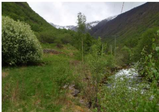
Område for kraftstasjon.