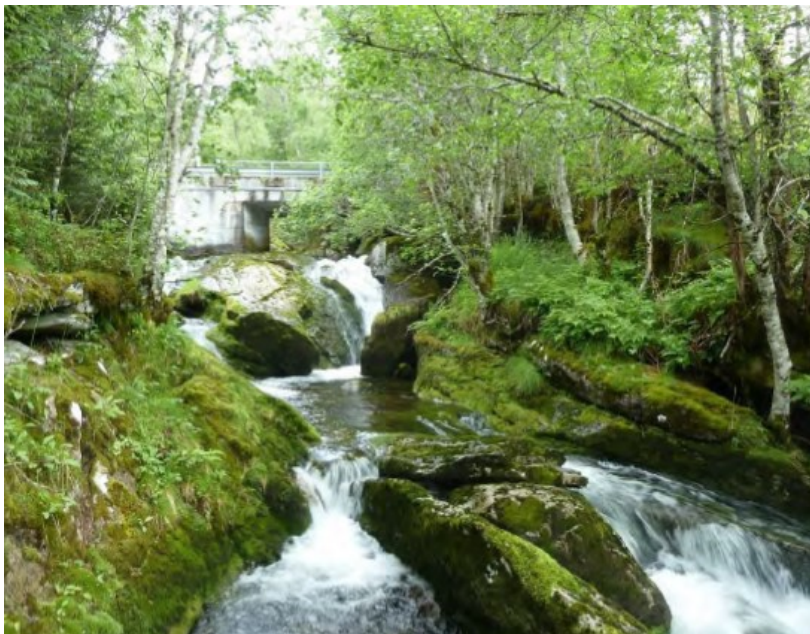
Kvitfella, nedstrøms fylkesvegen (Fv 697)