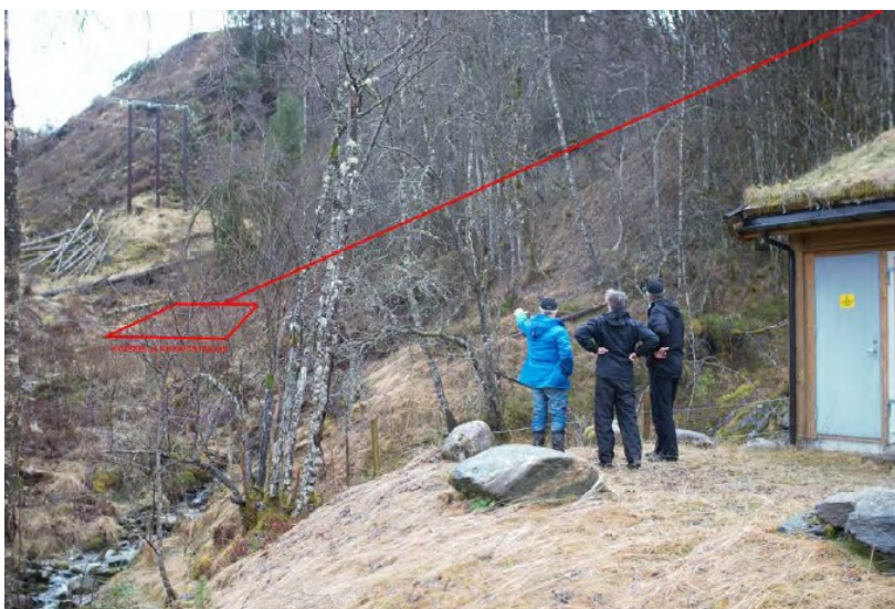
Eksisterende kraftstasjon til høyre. Ny rørgate og ny stasjon på andre sida av elva er markert med raud strek.