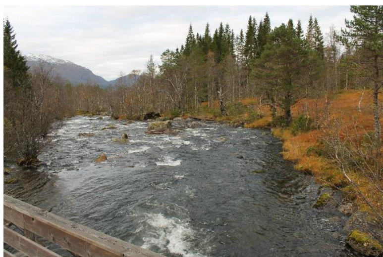
Foto nr. 11 i søkn. Elva sett nedover fra Stokkebrua, inntaksområdet til høyre