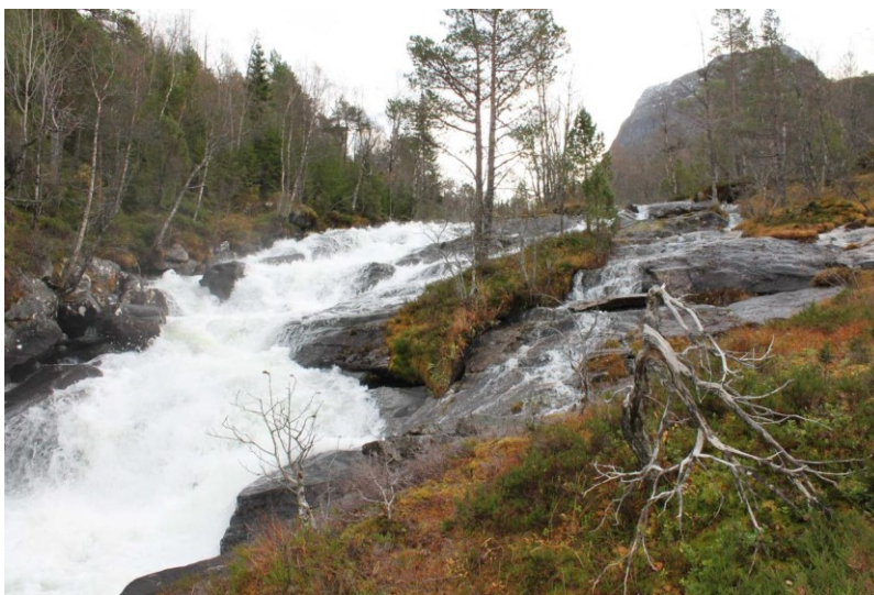
Foto nr. 8 i søkn. Ca. 200 meter ovanfor Tungelibrua.