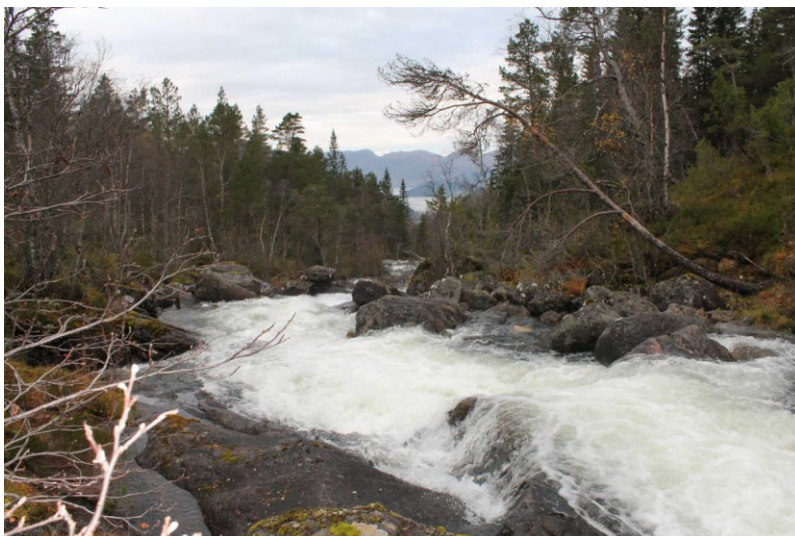
Foto nr. 10 i søknad. Frå vestsida av elva ca. 100 meter nedanfor inntaket.

Ved inntaket skal det byggast ein ca. 1 meter høg og 15 meter lang terskel tvers over elva. Terskelen vil demme opp eit areal på ca. 200 m 2 med volum ca. 200 m 3 . Inntakskanalen ved sida av elva vil bli 3 meter djup og 10 meter lang. Øvre delen av rørgata skal leggjast i skrånninga mellom elva og vegen. Vidare nedover i skogsterreng og over eit dyrkingsfelt til planlagt kraftstasjonen med grunnflate 70 m 2 på kote 92. På same nivå, men på andre sida av elva, skal kraftstasjonen til Breidalselva kraftverk byggast. Det må byggast ca. 50 meter anleggsveg til inntaket frå eksisterande veg og ca. 50 meter permanent veg til kraftstasjonen frå eksisterande veg. Tilknytning til eksisterande nett er planlagt med ca. 600 meter jordkabel.