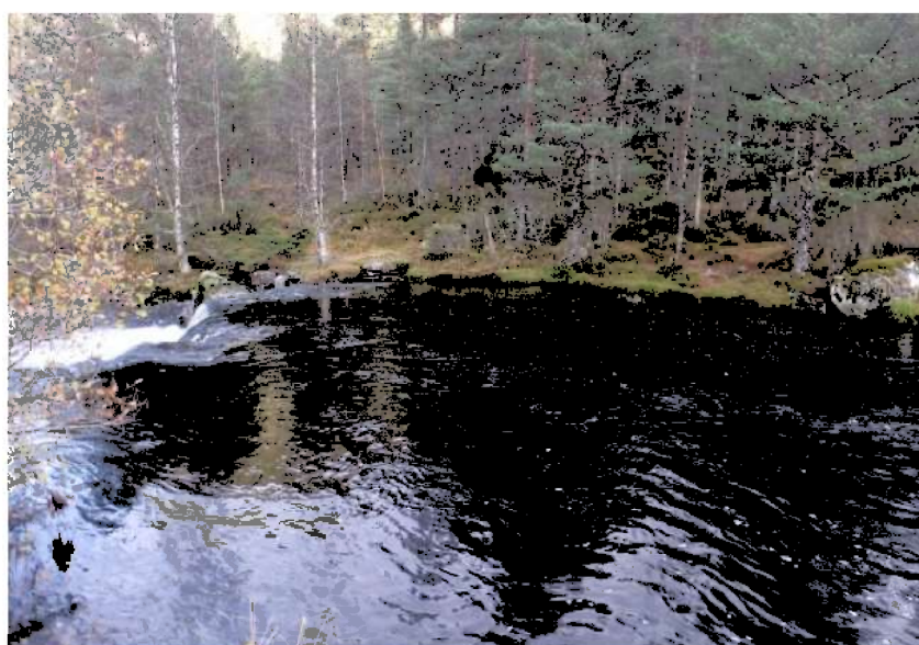
Inntaksområdet sett frå vest (fylkesvegen)

Det er planlagt inntak på østsida til elva. Her skal det leggjast rør bort frå elva til eit lukka inntaksbasseng. Det skal ikkje byggast demning over elva. Rørgata skal gravast ned eit stykke frå elva og nedover til den planlagde kraftstasjonen på utbyggjaren sitt gardsbruk, kote 78. Den øvre delen av rørgata (730 meter) vil gå gjennom skog, medan den nedre delen vil gå gjennom beitemark (220 meter). Kraftstasjon med grunnflate 70 m 2 er planlagt på kote 58 om lag 150 meter sørvest for tunet til utbyggjaren. Avløpet frå stasjonen skal gå i eit rør til elva. Det er planlagt anleggsveg til inntaket frå fylkesvegen og over elva eit stykke nedanfor inntaket. Vegutløysing for kraftstasjonen vert gjennom gardstunet til søkjaren. Nett-tilknyting er ikkje endeleg planlagt og kan bli ein kombinasjon mellom kabel og kraftlinje til Vårdal eller Nordeidet (lengde ca. 1 km)