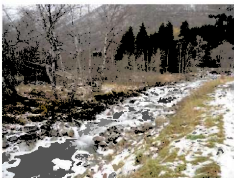
Fotografi 11: Nedre del av Kvemma, eksisterende gangbro sees i bakgrunnen