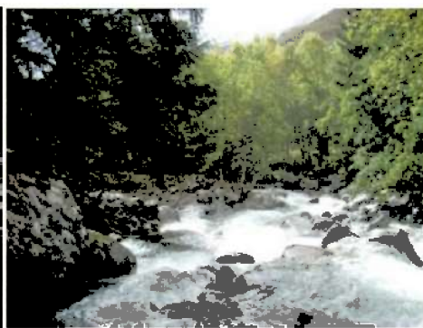
Fotografi 10: Naturlig elveløp Kvemma