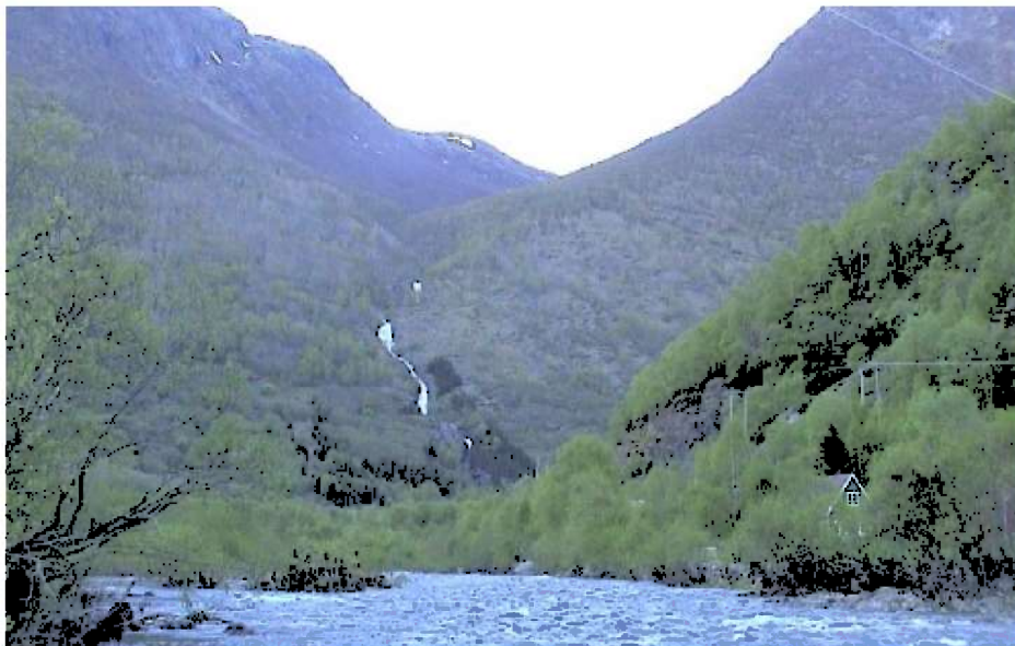
Volldøla nedanfor planlagt inntak. Lærdalselvi i framgrunnen.