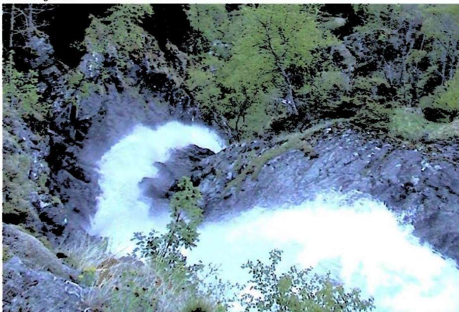
Bratt parti i Volldøla.