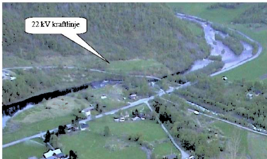
Lærdalelvi og gamle E16

søkk i terrenget ved gamle E16. Nett-tilknytning er planlagt via ein 230 meter lang jordkabel til ei kraftlinje langs sørsida til Lærdalselvi. Kabelen må festast til brua over Lærdalselvi.