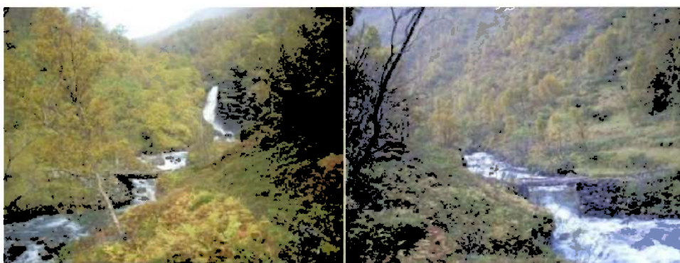
Inntaksområdet i Kvemna ved gangbru. Til venstre: sett oppover. Fossen vil ikkje bli påvirka. Bildet til høgre: inntaksområdet sett nedover.