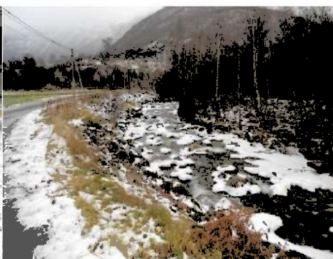
Fotografi 12: Nedre del av Kvemma