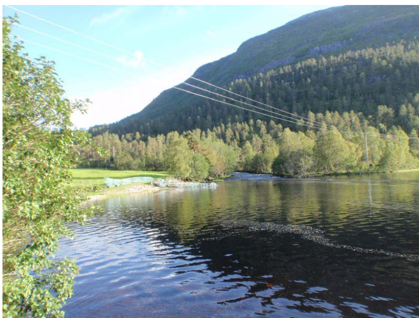
Kraftstasjonsområdet på dyrka mark ved Røyrvikelva sitt utløp i Røyrvikvatnet.