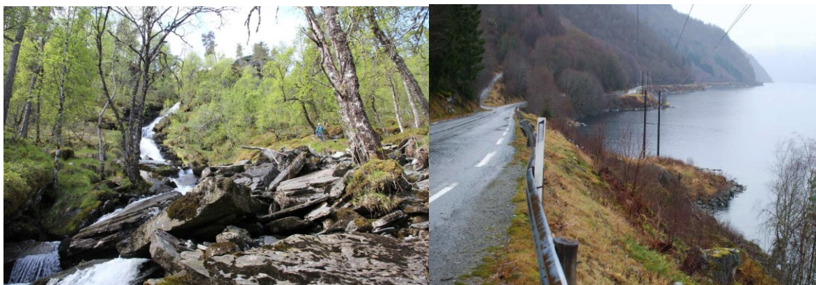
Venstre: Vtlebrattstigen. Høgre: Kraftstasjonen er tenkt plassert på neset nær kraftlinja.