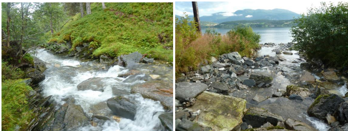
Venstre: Inntaksområdet. Høgre: Elva sitt utløp i fjorden.