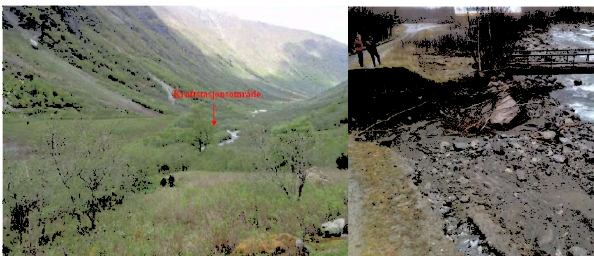
Venstre bilde: Raud pil viser plass for kraftstasjon. Deponert masse frå Lærdalstunnelen til venstre.