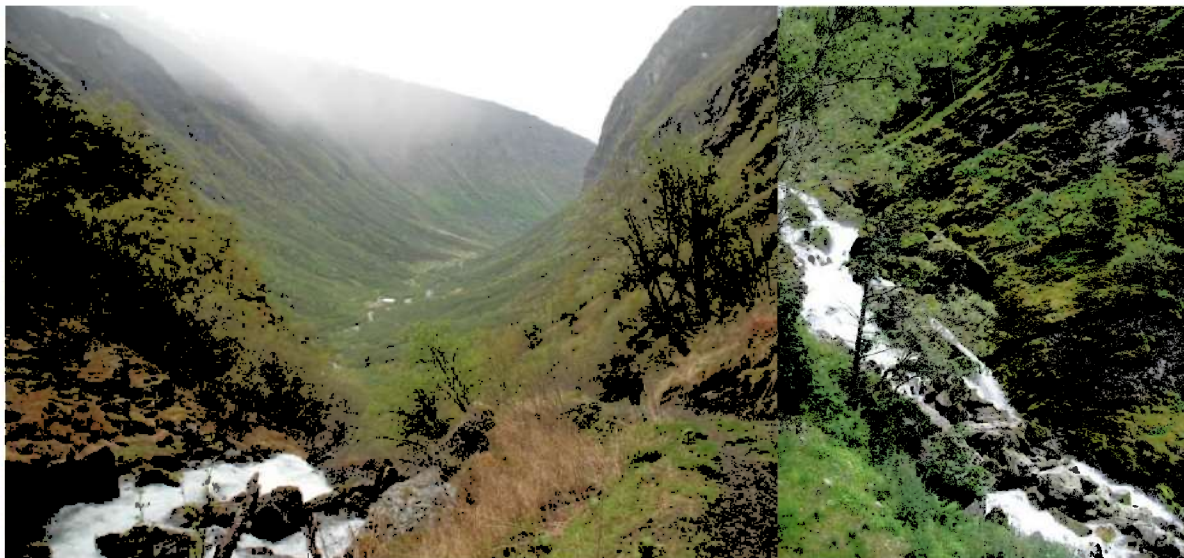
Venstre: Tynjadalen sett frå Trollelii.