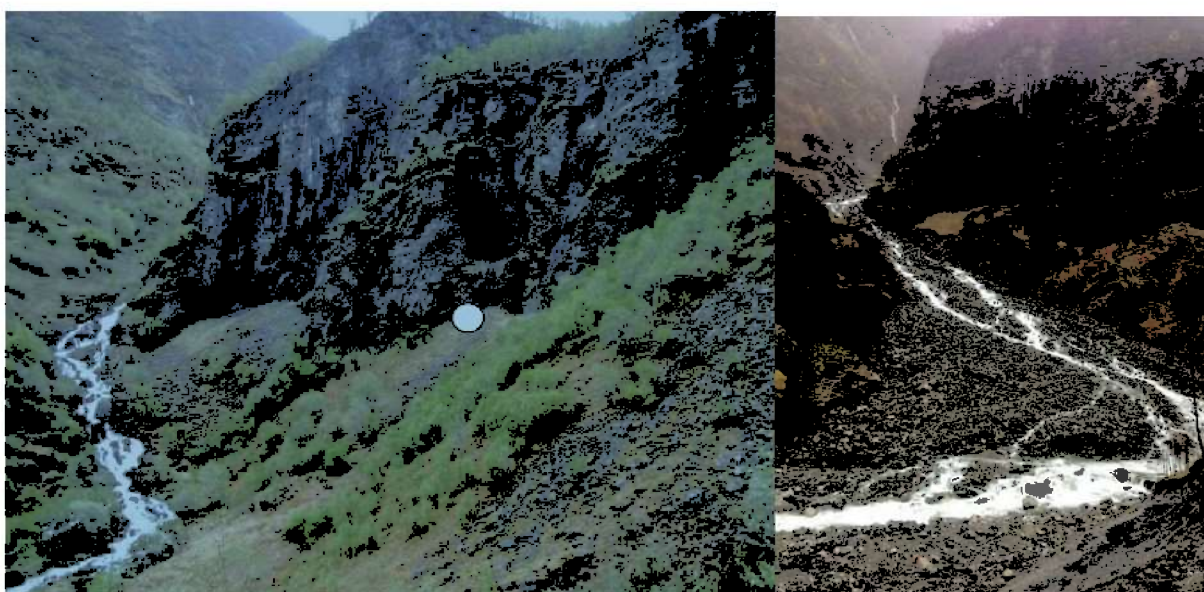
Venstre: Tynjadalsbotnen. Viser påhogg for tunnel.