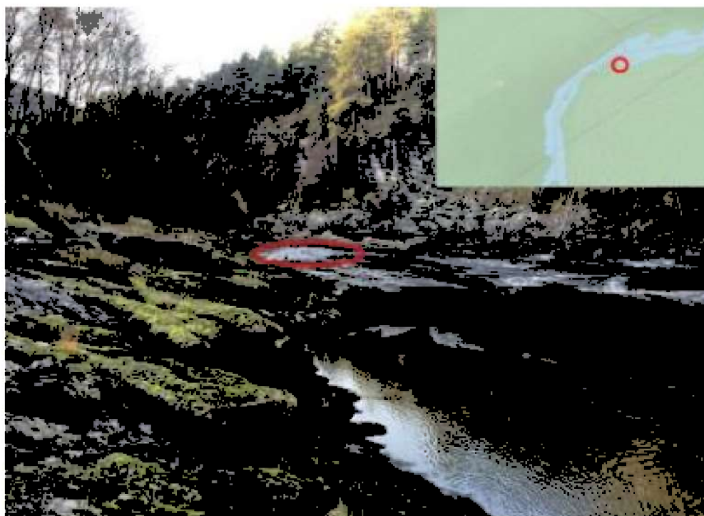
Kulp der inntaket til rørgata er planlagt.

Mellom elva og rørgata ønskjer søkjaren å bygge ein fin gråsteinsmur som seinare skal danne ein tursti. Til inntaket skal det byggast anleggsveg. Stasjonsområdet er ved enden av dyrka mark der det er eksisterande veg. Vegen skal rustast opp og forlengast fram til kraftstasjonen. Anlegget skal knytast til 22 kV-linja på andre sida av elva via ein 100 meter lang jordkabel.