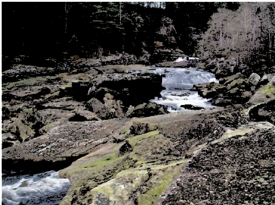
Oppstrøms planlagt kraftstasjonen. (Fig. 14 i søknaden). Foto 28.10.2009: Vassføring 1,23 m 3 /sek

kommer her frå eit flatt lende gjennom landbruksområder. Etter passering av et eventuelt inntakspunkt, renner elva i små stryk over steinar og fjell med glattskura steinar og svaberg som ein kan sjå av Figur 14. Vidare renner den igjen inn i et flatare jordbruksområde og renner gjennom Yndestadhølen, før den renner inn i Hovlandsdalsvatnet. Inntaket vert i eksisterande kulp, oppstrøms denne er det eksisterande veg som vil verte nytta ved utbygginga. Det vil såleis ikkje vert nye inngrep i landskapet som følgje av dette.