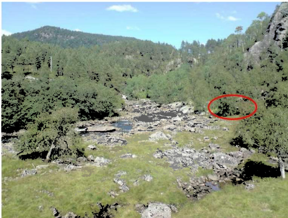
Tomt for kraftstasjonen, sett oppover elva.