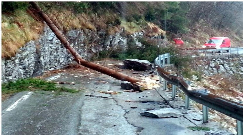
Dei fleste tok Terje Skamo med mobilen like etter raset. Største blokk hadde sprutte over rekkverket og vidare ned i ura nedanfor vegen.

Hopsstranda er lunefull!! Trass i rassikring av fleire parsellar langs Hyestranda er det framleis rasfarlege parti igjen. Oppslaget under er frå Firda Tidend si nettside.